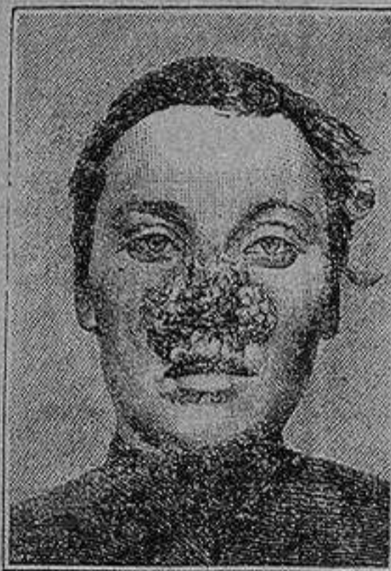
Antes de la curacion