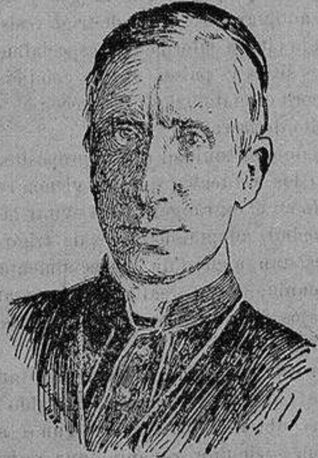
El cardenal norteamericano Hibbons que ha realizado importantes trabajos en favor del restablecimiento de la paz