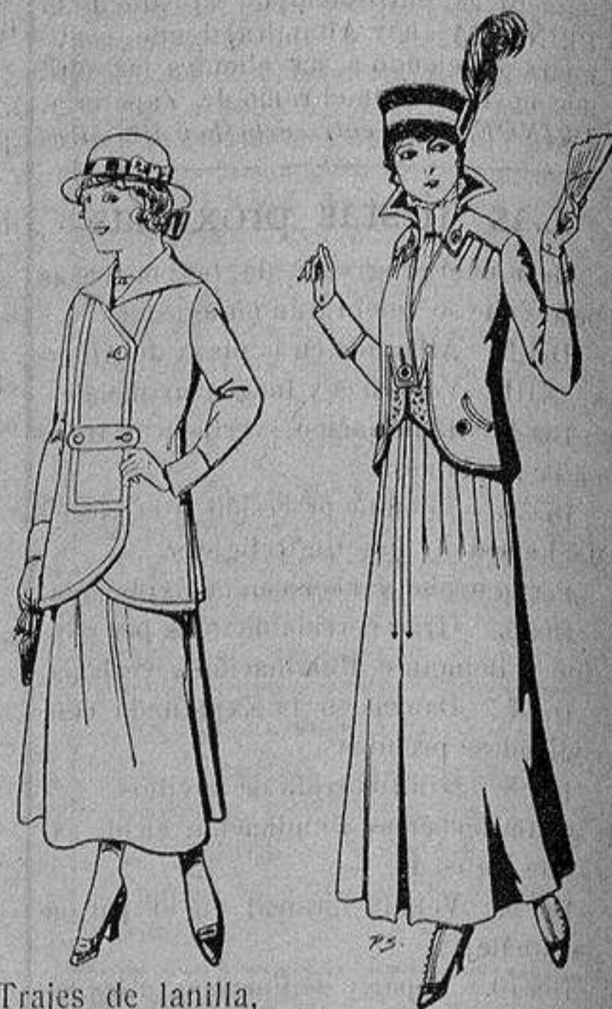
Trajes de lanilla, para jovencitas de 13 a 15 años De ptas. 27 a 30 Trajes de lana negra, azul, para señora A 55 ptas.