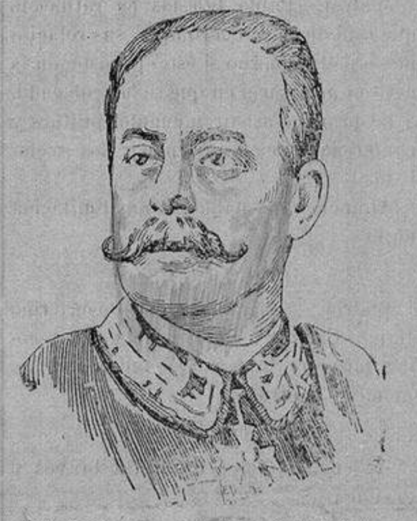
El teniente general italiano SPINGARDI