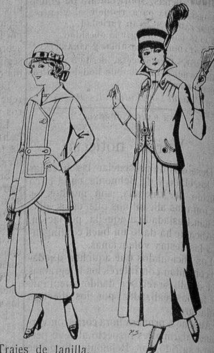
Trajes de lanilla, para jovencitas de 13 a 15 años azul, para señora De ptas. 27 a 30 A 55 ptas.