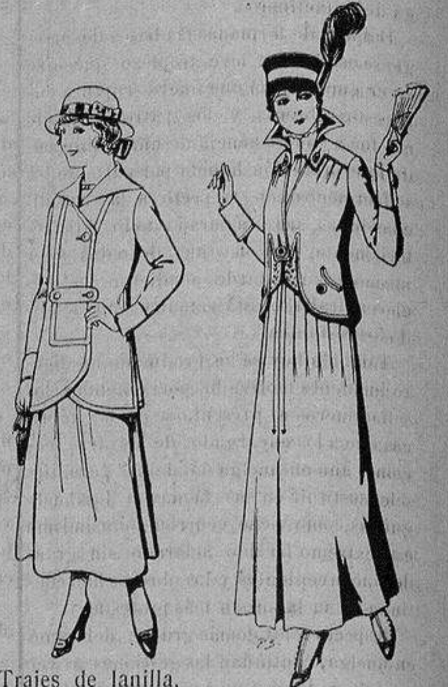
Trajes de lanilla, para jovencitas de de 13 a 15 años De ptas. 27 a 30 Trajes de lana negra, azul, para señora A 55 ptas.

Ropas confeccionadas para Caballero, Señora, Niño y Niña