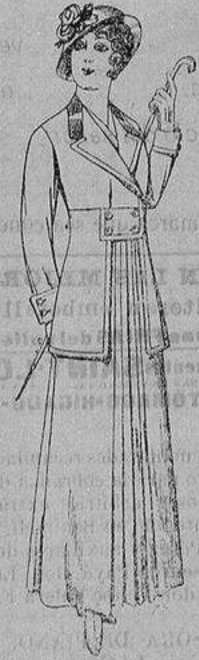
Trajes de lana ne- gra azul y color pa- ra señora A ptas.