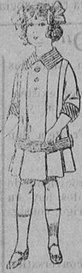
Vestidos de dril para niñas de 4 a 12 años De ptas. 5 a 12