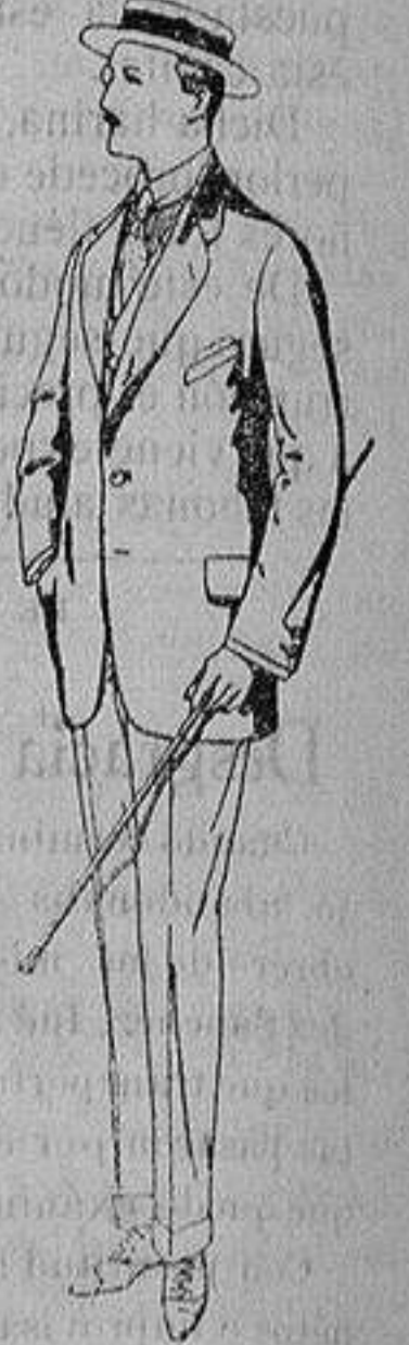
Trajes de alpaca negra De ptas. 32 a 56