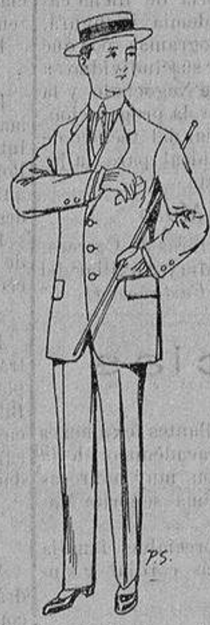
Trajes de lanilla, vi- cuña, etc., para niños de 10 a 16 años De ptas. 14 á 48