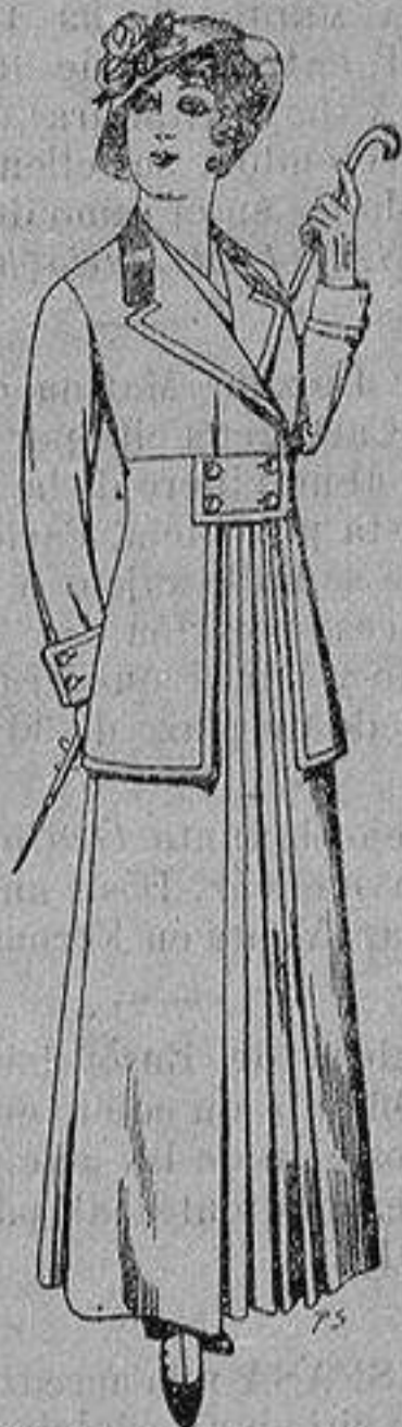
Trajes de lana negra azul y color para señora De ptas. 70