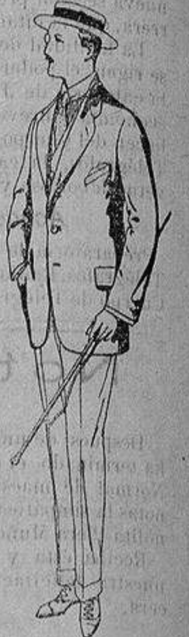
Trajes de alpaca negra De ptas. 32 a 56