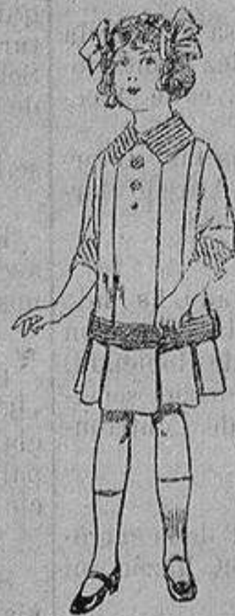
Vestidos de dril para niñas de 4 a 12 años De ptas. 5 a 12