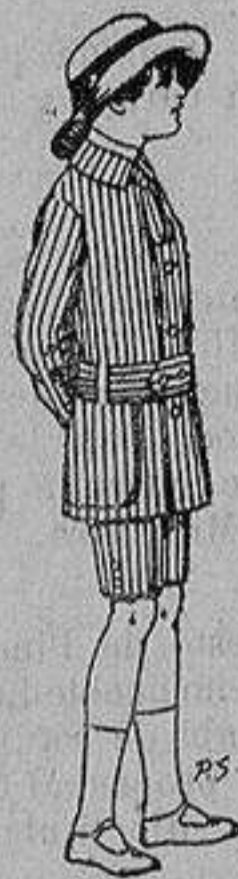
Trajes de dril listado para niños de 4 a 9 años De ptas. 4 a 13