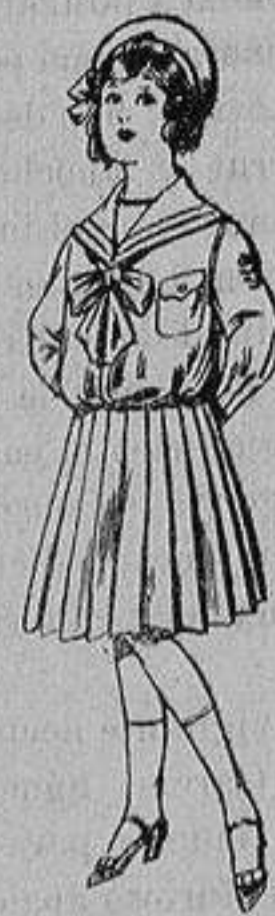
Trajes de lani- nilla, para ni- ños de 4 a 12 años De ptas. 28 a 38