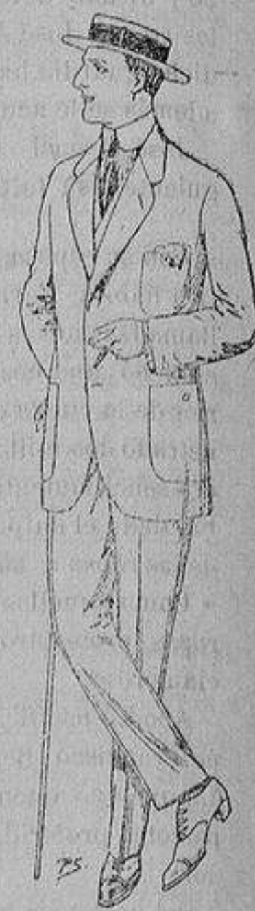
Trajes de dril cru- do, kaki o listado De ptas. 10 a 32

Ropas confeccionadas para Caballero, Señora, Niño y Niña