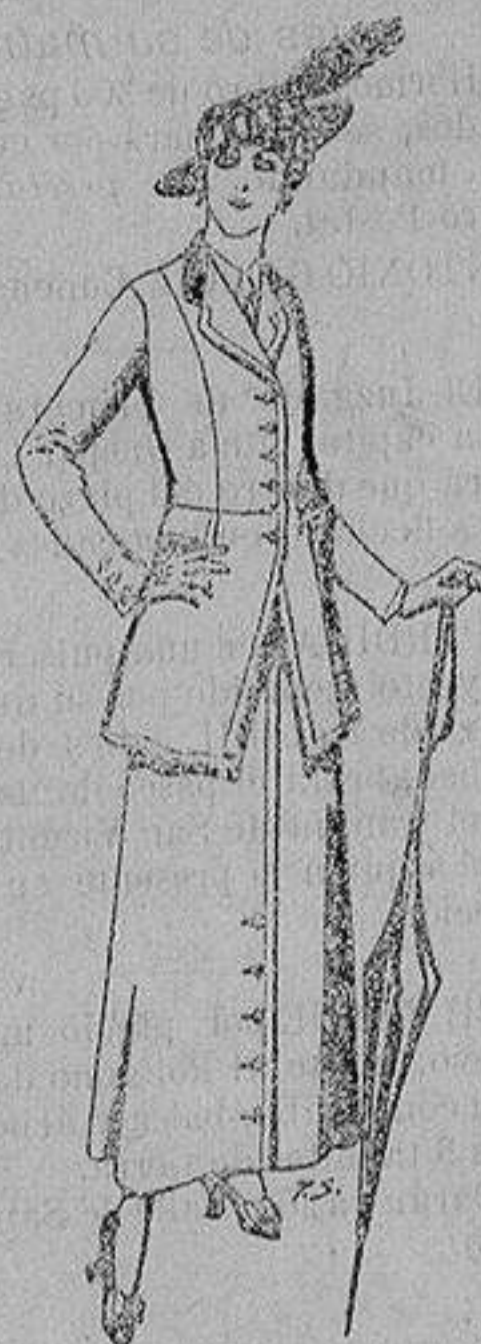
Trajes lana negra, azul y color A ptas. 55

Madrid * Barcelona * Almería * Bilbao * Cádiz Cartagena * Gijón * Granada * Málaga * Pal- ma de Mallorca * Santander * Sevilla * Valencia Valladolid y Zaragoza