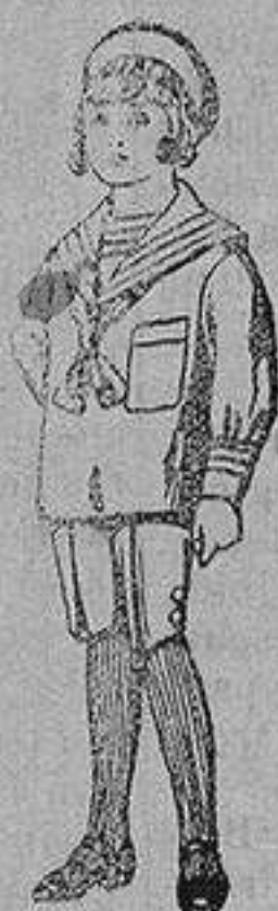
Trajes de jerga azul bordado oro en la manga para niños de 4 a 9 años De 20 a 22 ptas.

Ropas confeccionadas para Caballero, Señora, Niño y Niña