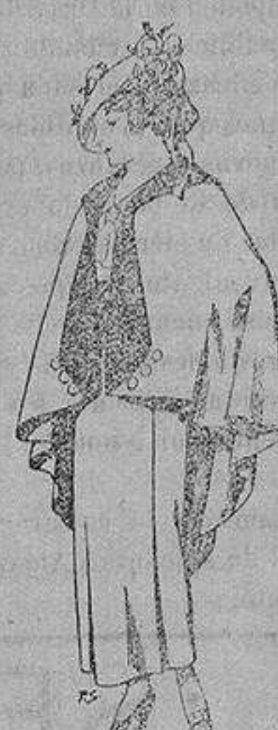
Capas de lana para jovencitas de 13 a 16 años A 25 pesetas