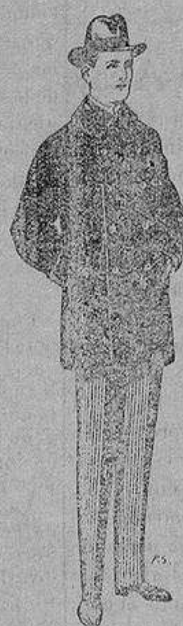
Pellizas con cuello y bocamangas de astrakan De 11 a 40 ptas