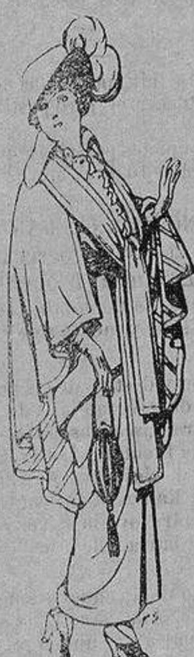
Capas de lana para señora A 20 ptas.