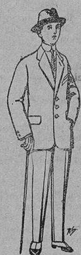
Trajes de paten, vicuña, etc., para niños de 10 a 16 años De 13 a 48 ptas.