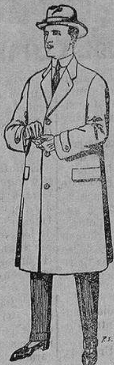
Gabanes de tejidos pluma satina, etc. De 17'50 a 70 ptas.