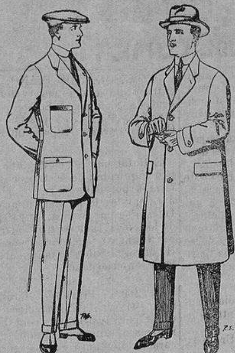
Trajes de cheviot, corte elegante para «Sportmen» De 45 a 55 ptas.

Madrid, Barcelona, Alicante, Almería, Bilbao, Cádiz, Cartagena, Gijón, Granada, Málaga, Palma de Mallorca, Santander, Sevilla, Valencia, Valladolid y Zaragoza