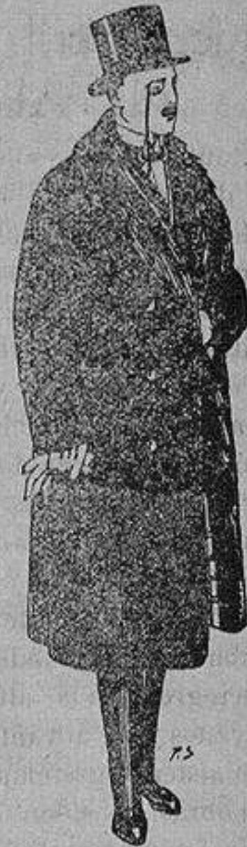
Gabanes de coccó negro, forro seda, cuello y vistas de piel a 125 ptas.