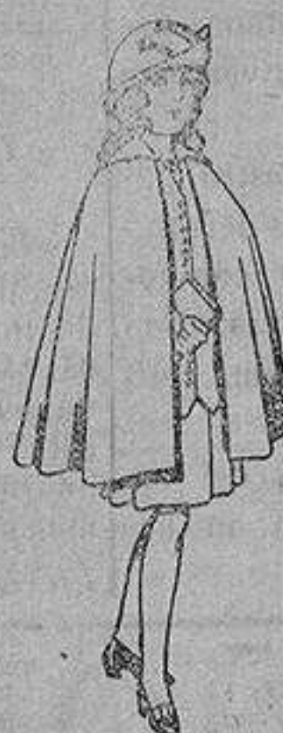
Capas de lana para niñas de 4 a 12 años De 20 a 22 ptas.

SECCIONES: Peletería, Camisería, Géneros de Punto, Corbatería, Guantería, Sombrerería, Zapatería, Paraguas, Bastones y Artículos de Viaje.