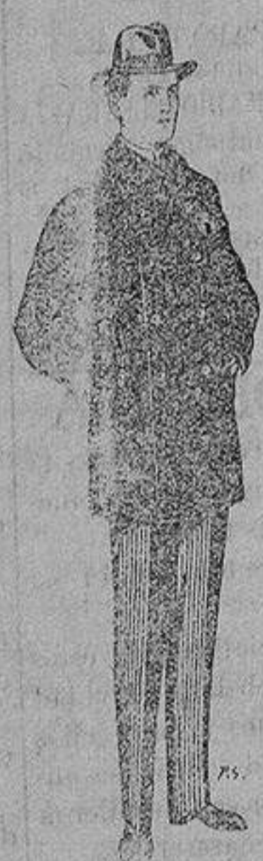
Pellizas con cuello y bocamangas de astrakan De 11 a 40 ptas