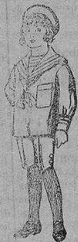
Trajes de jerga azul bordado oro en la manga para niños de 4 a 9 años De 20 a 22 ptas.

Ropas confeccionadas para Caballero, Señora, Niño y Niña