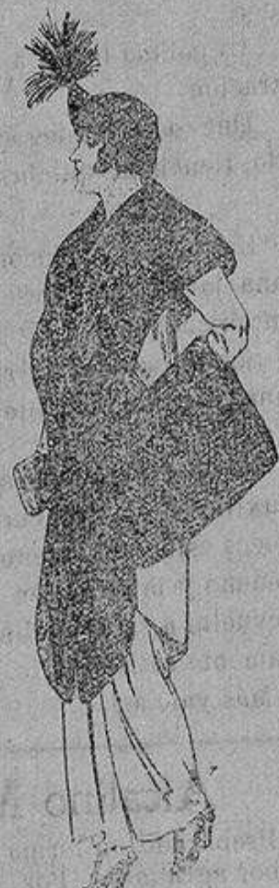
Juego de pieles de loutre de Nord para Señora 145 ptas.

SECCIONES: Peletería, Camisería, Gé-neros de Punto, Corbatería, Guante-ría, Sombrerería, Zapatería, Paraguas, Bastones y Artículos de Viaje.