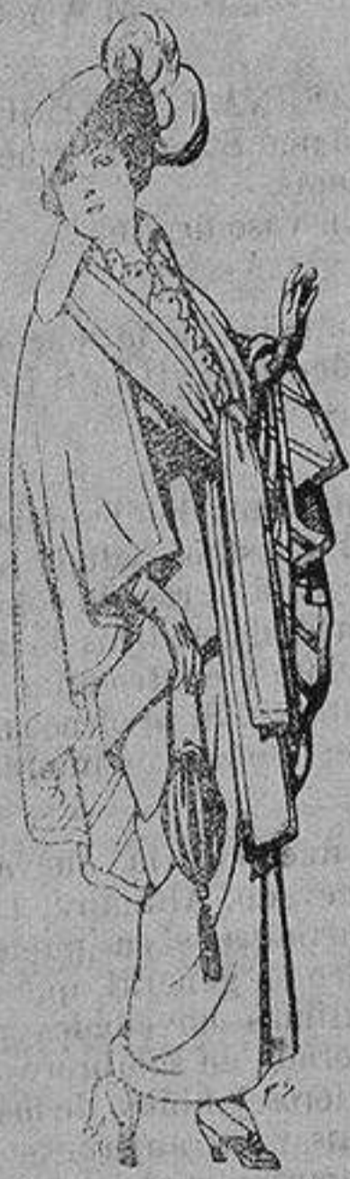
Capas de lana para señora A 20 ptas.