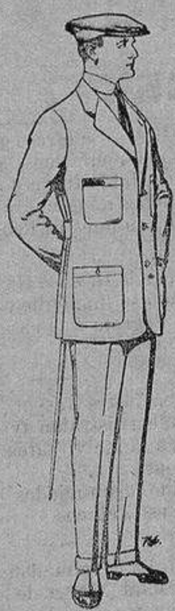
Trajes de cheviot, corte elegante para «Sportmen» De 45 a 55 ptas.

Madrid, Barcelona, Alicante, Almería, Bilbao, Gá-diz, Cartagena, Gijón, Granada, Málaga, Palma de Mallorca, Santander, Sevilla, Valencia, Valladolid y Zaragoza