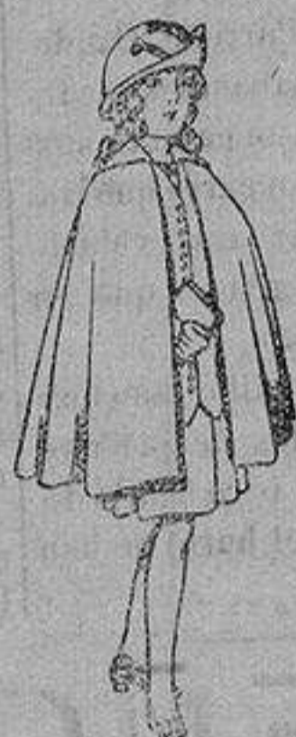
Capas de lana para niñas de 4 a 12 años De 20 a 22 ptas.