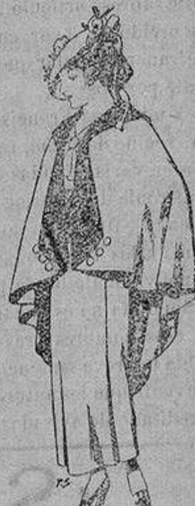
Capas de lana para jovencitas de 13 a 16 años A 25 pesetas