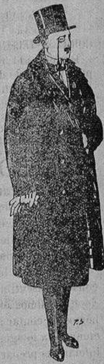
Gabanes de edredó negro, forro seda, cuello y vistas de piel a 125 ptas.