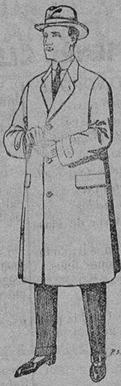
Gabanes de tejidos pluma satina, etc. De 17'50 a 70 ptas.