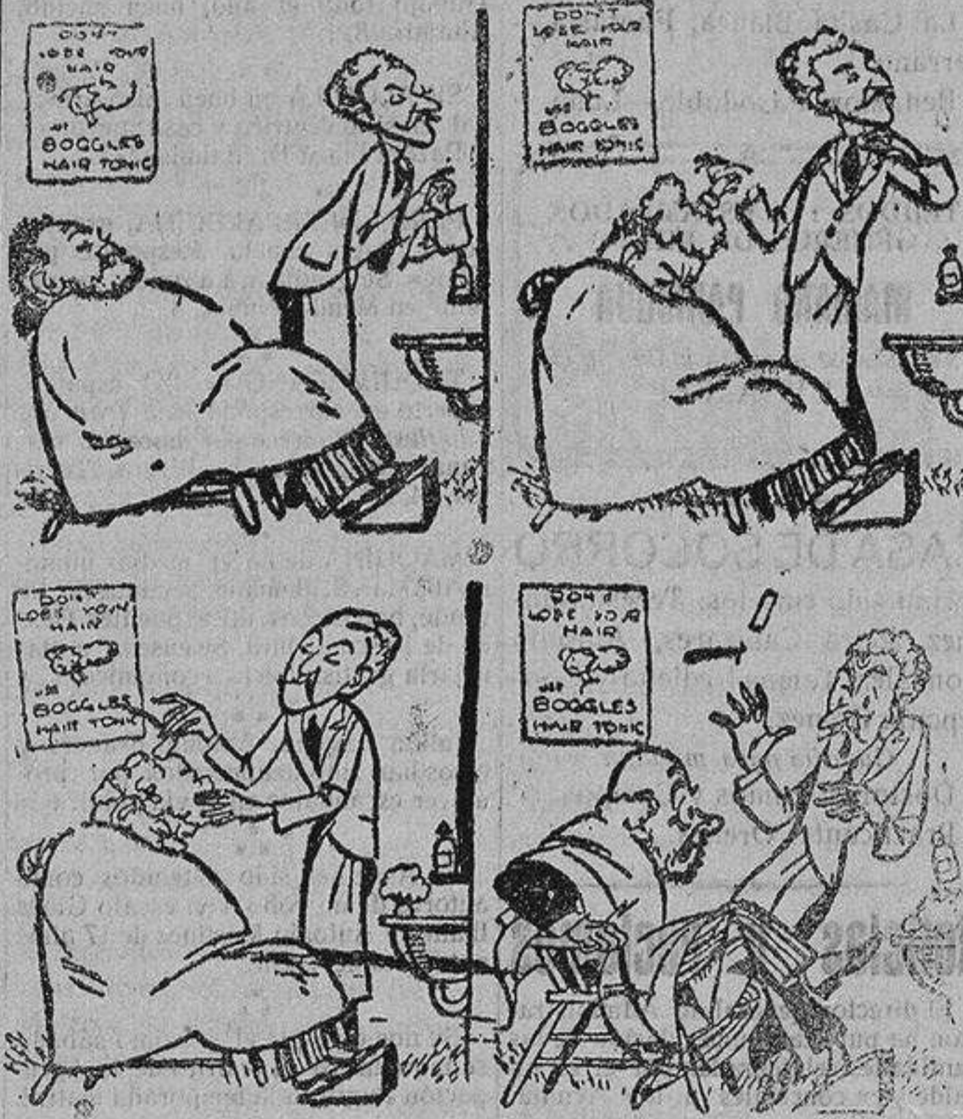
EL PARROQUIANO QUE SE QUEDO DORMIDO