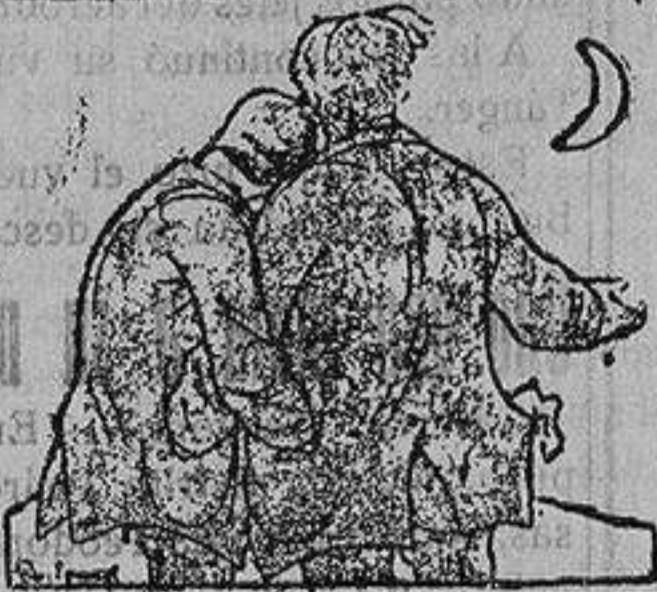
Triste por delante y por detrás (De «Izvestia» Moscú).