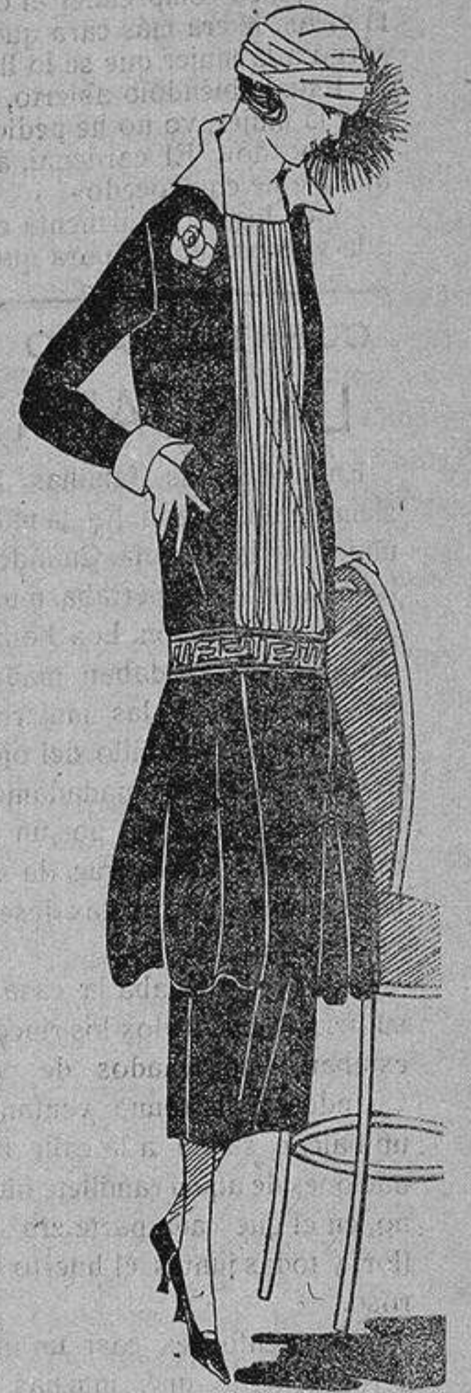
Elegante toilette de mañana

SARNA Antiséptico Marti, el único que la cura sin baño. Sus imitaciones resultan caras, peligrosas y apestan a letrina. Venta en todas las farmacias.