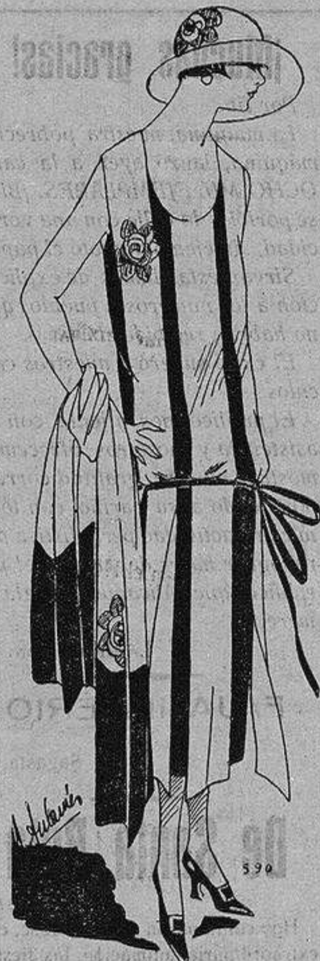
Vestido de musolina verde, adornado con tiras de terciopelo claro y rojo.