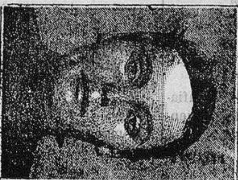
Después de la curación