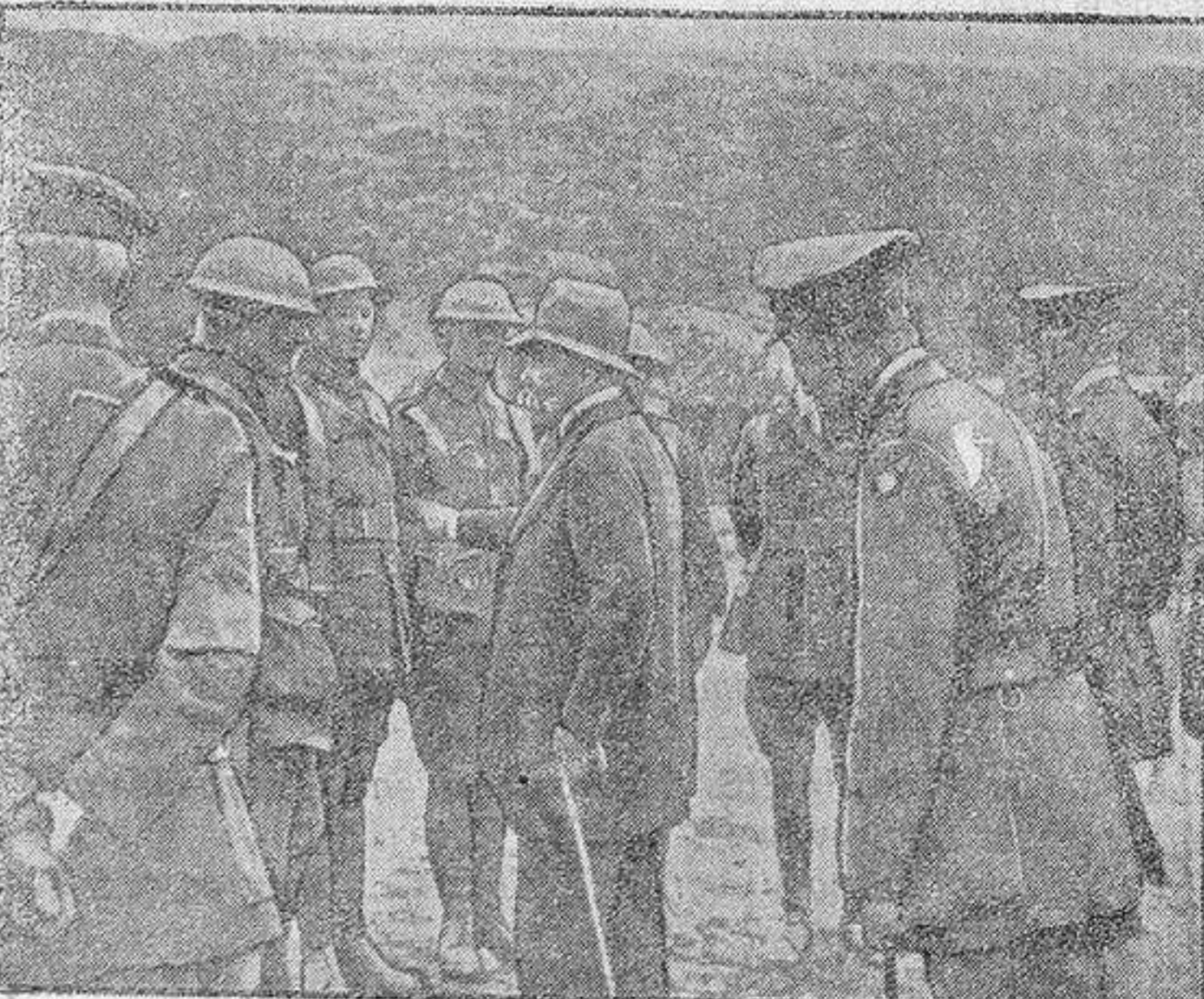
Mr. Clemenceau hablando con los soldados en el frente