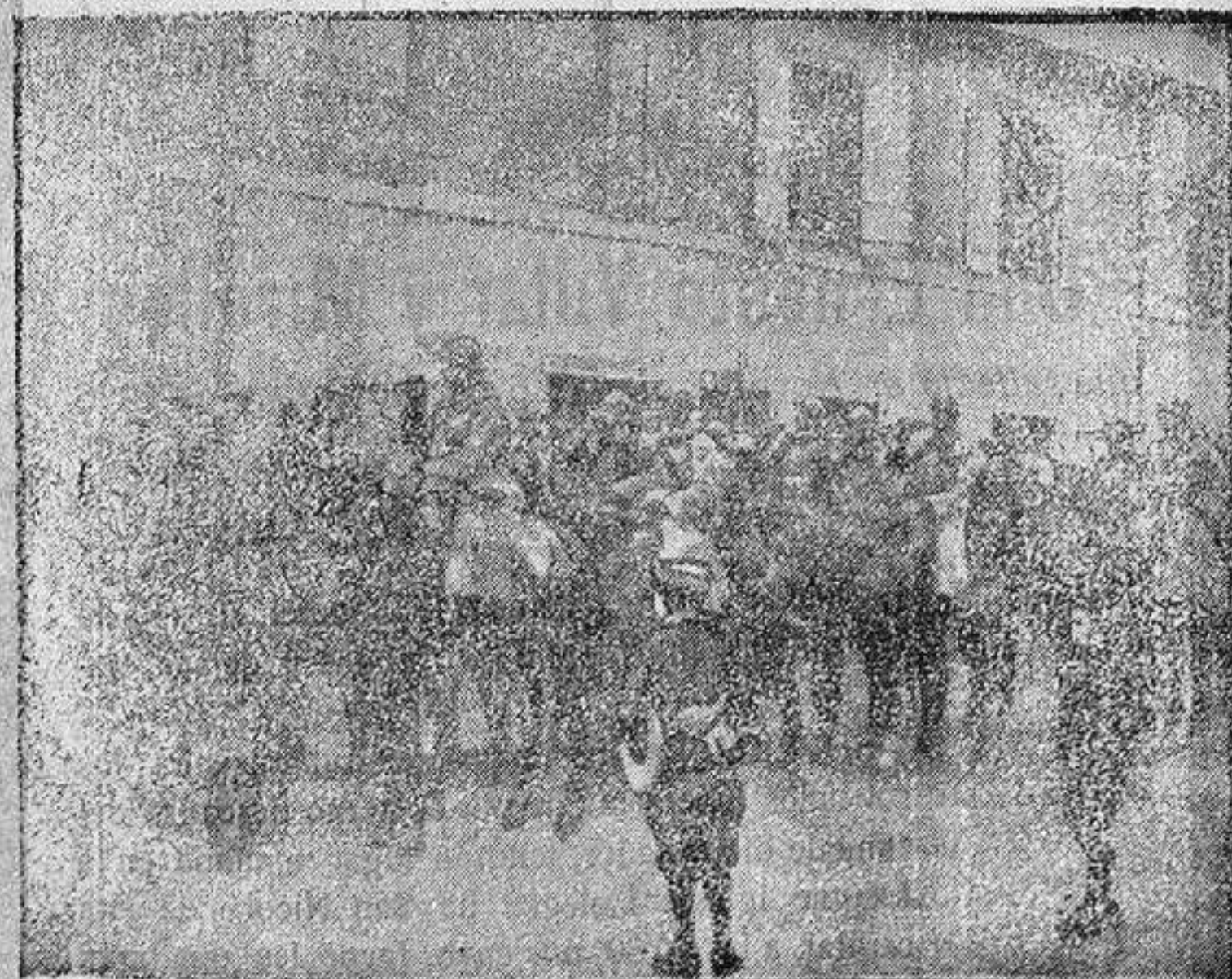
Desfile de caballería francesa