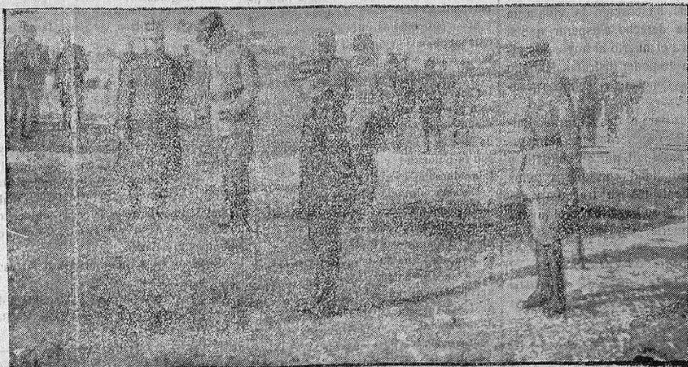
MISION MILITAR FRANGESA EN EL EJERCITO GRIEGO