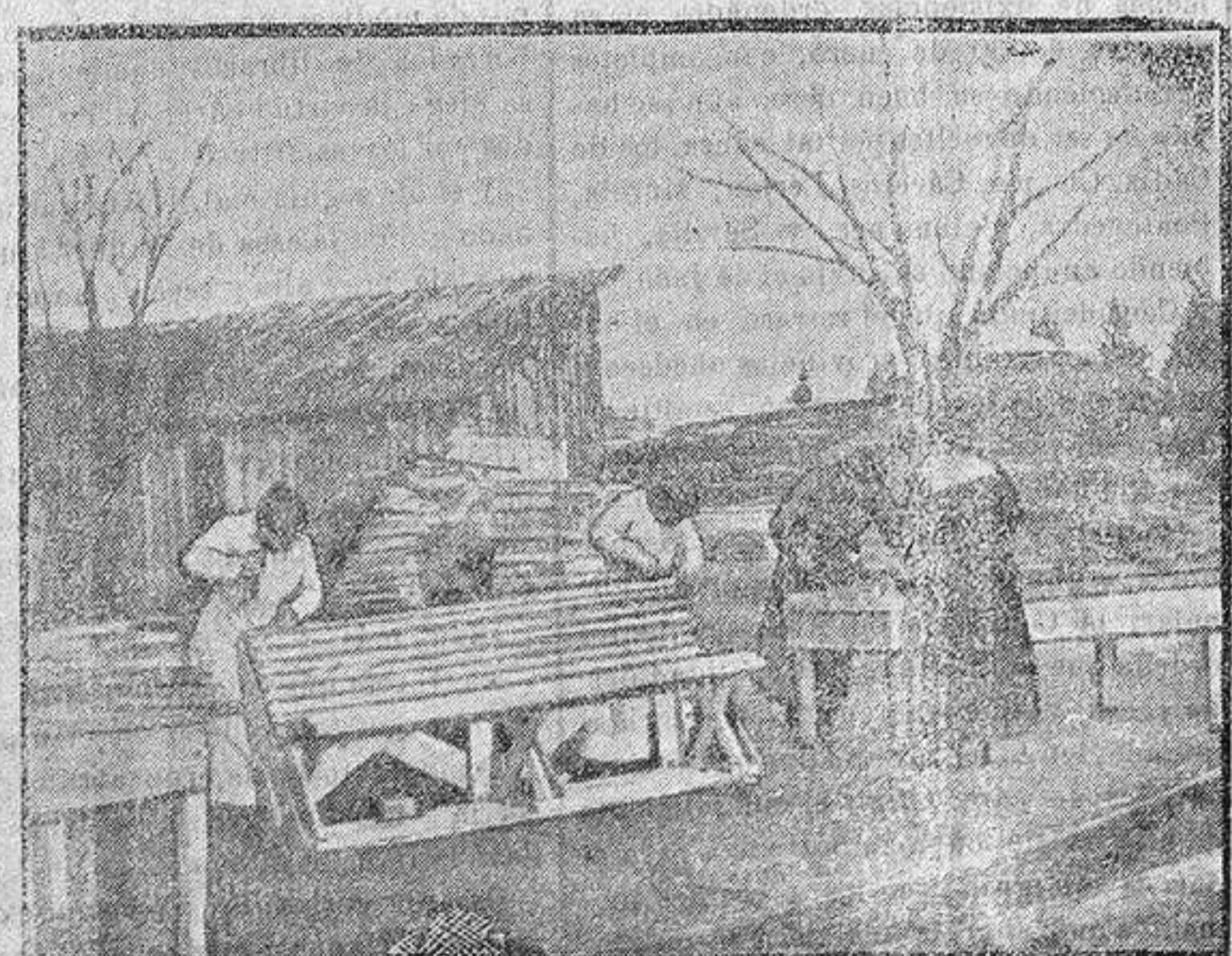
Mujeres trabajando en las serrerías militares