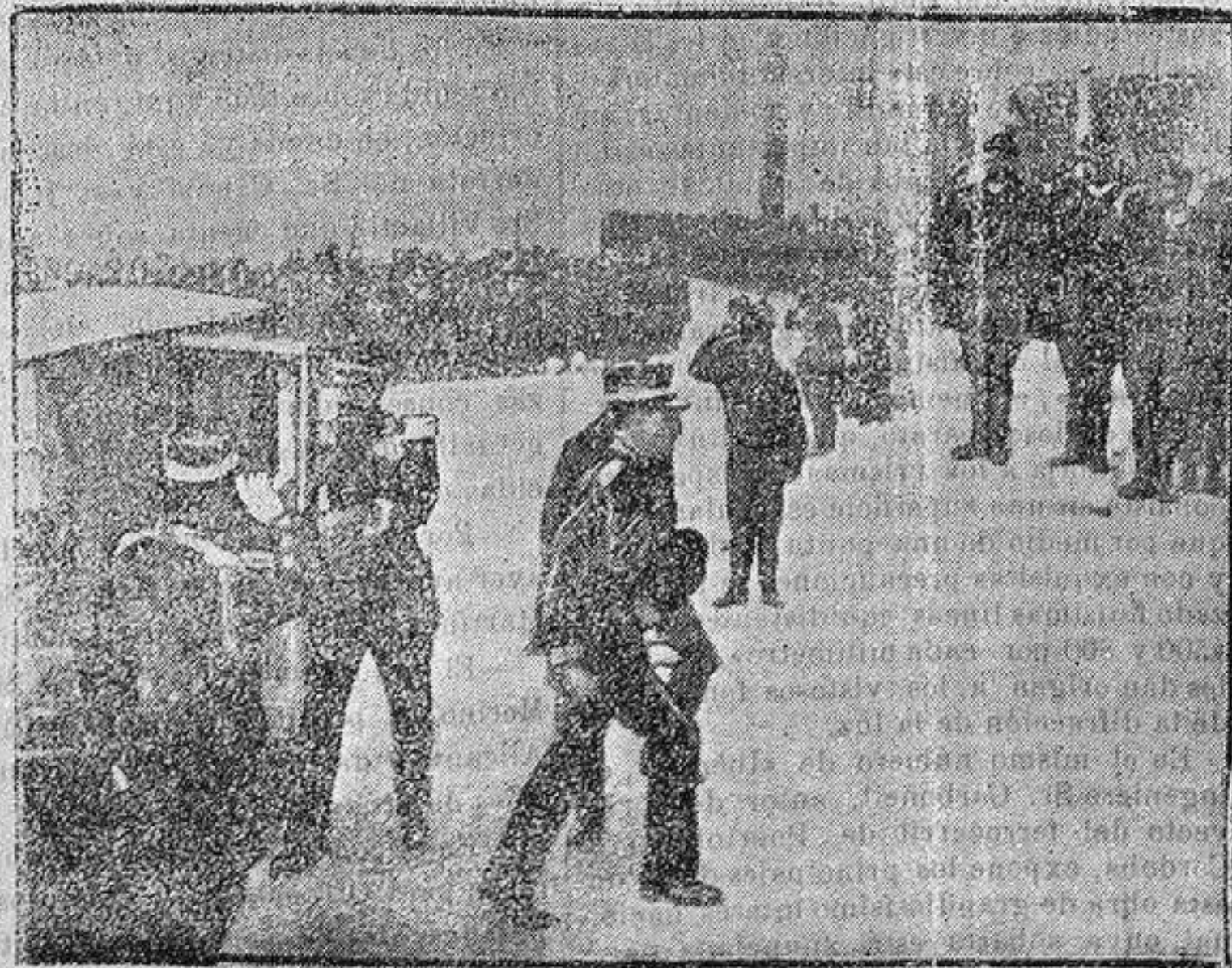
El rey de Grecia llegando a la Catedral de Atenas para asistir al «tedium» de honor de la toma de Jerusalén