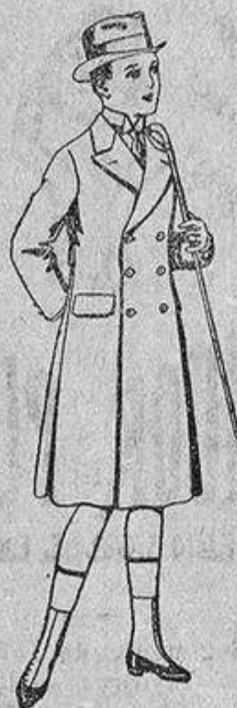
Gabanes de patén para niños de 4 a 9 años, de ptas. 16 a 50.