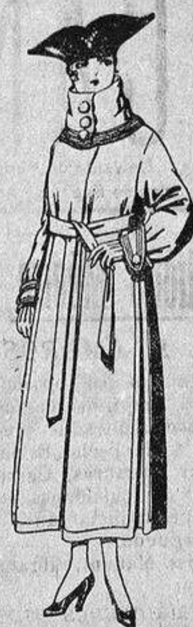
Abrigos de pañete, colores azul, beige y café, de ptas. 65 a 85