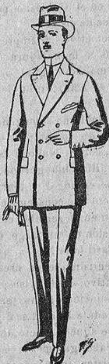
Trajes de cheviot, melton etc., de ptas. 26 a 85. Los mismos en vicuña o jerga, de ptas. 32 a 90.