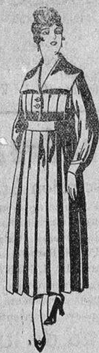
Batas de lanilla diferentes colores, a pesetas, 25.

Madrid, Barcelona, Alicante, Almería, Bilbao, Cádiz, Cartagena, Gijón, Granada, Málaga, Palma de Mallorca, Santander, Sevilla, Valencia, Valladolid y Zaragoza.