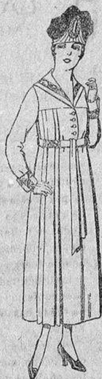
Vestidos de sarga inglesa, en negro, azul y color, bordados, de de ptas. 60 a 70.