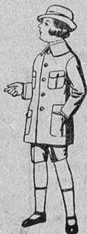
Trajes de patén modelo «Sport», para niños de 4 a 9 años.