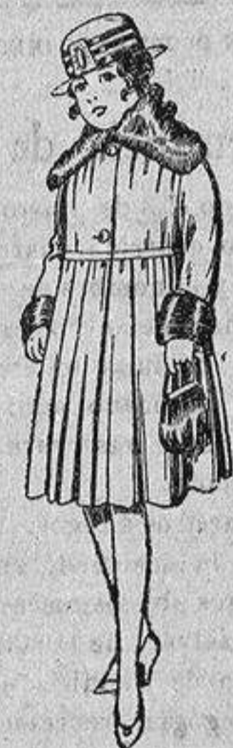
Abrigos de terciopelo de lana, pañete, gamuza, etc., cuello y bocamangas piel, para niñas de 4 a 9 años, de pesetas 28 a 48