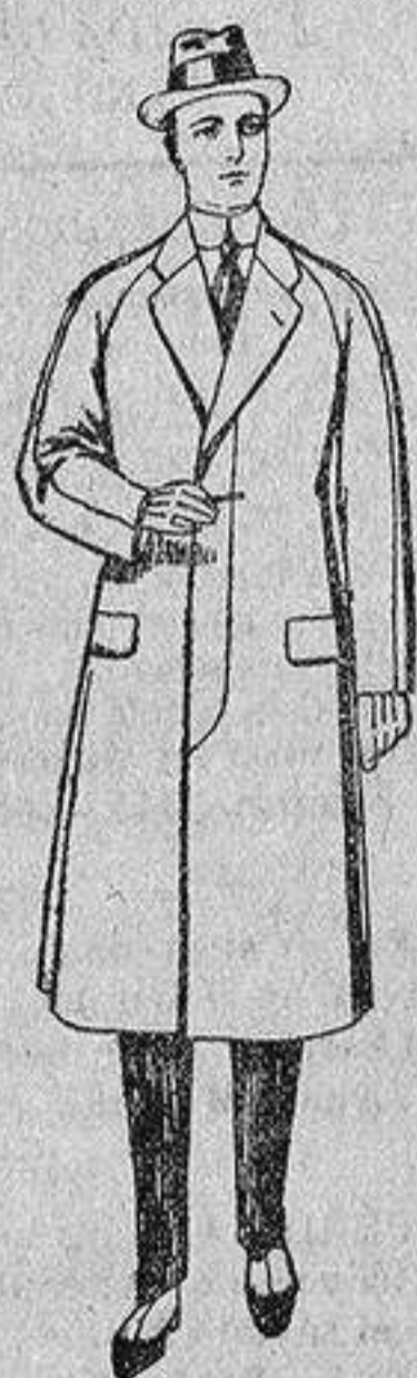
Gabanes de patén, melton o cheviot, con forro de seda, satén o escocés, de ptas. 50 a 100