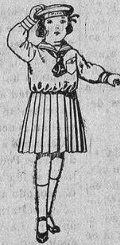
Trajes de marinera de sarga inglesa azul, para niñas de 4 a 9 años, de ptas. 30 a 35.