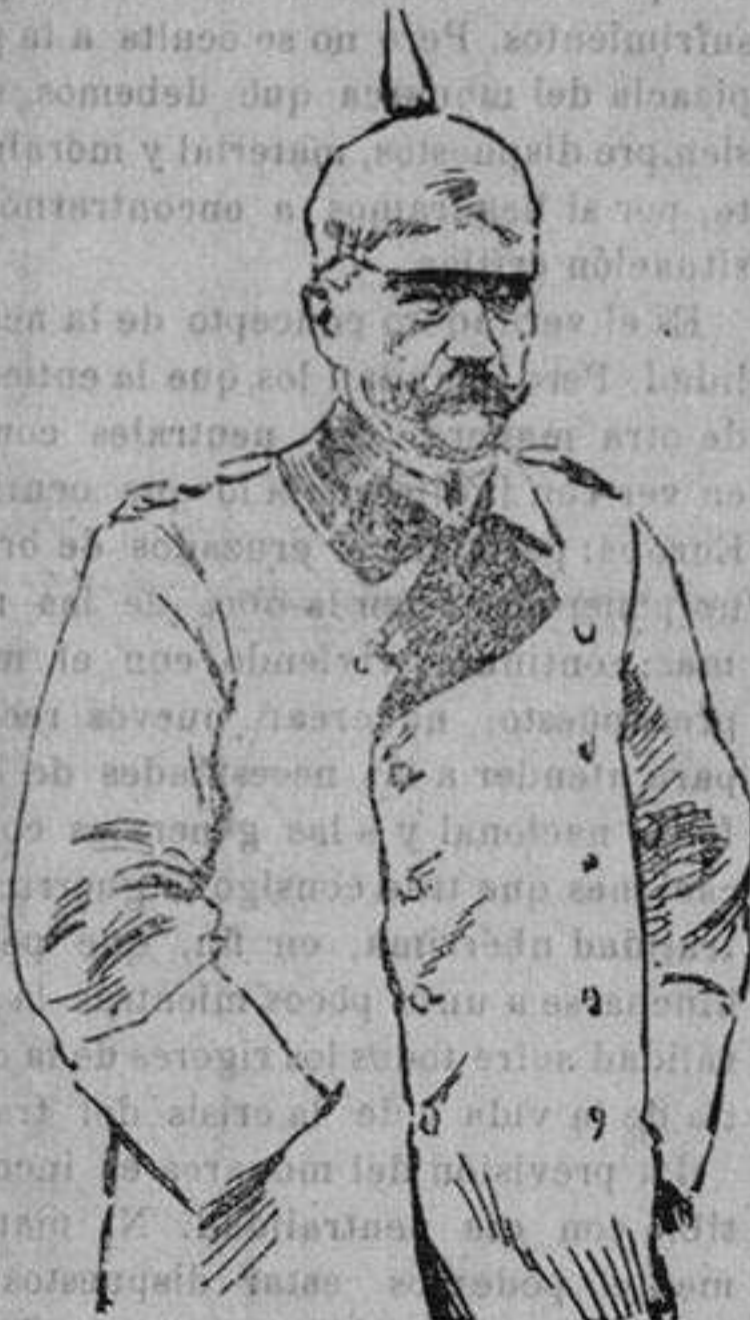
Mariscal von HINDEMBURG, nombra- do jefe del Estado Mayor alemán en sustitución de von Falkenhayn.