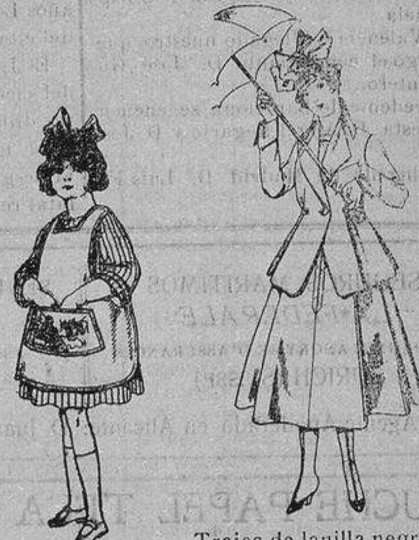
Delantal de dril color bedge De ptas. 3 a 7

Precio Fijo - Ventas al contado Pídase el Catálogo General