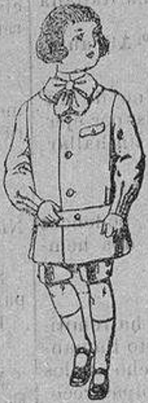
Trajes de lanilla en colores para niños de 4 a 9 años. De ptas. 9 a 18

Precio Fijo - Ventas al contado Pídase el Catálogo General