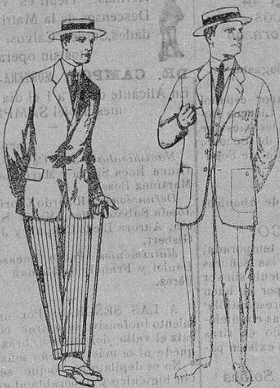
Trajes de alpaca negra De ptas. 32 a 50

Madrid, Barcelona, Alicante, Almería, Bilbao, Cádiz, Cartagena, Gijón, Granada Málaga, Palma de Mallorca, Santander, Sevilla, Valencia, Valladolid y Zaragoza.