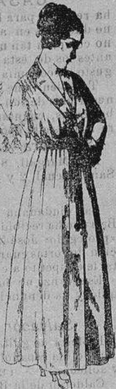
Bata crespón colores varios, cuello y boca-manga seda. De ptas. 15 a 20