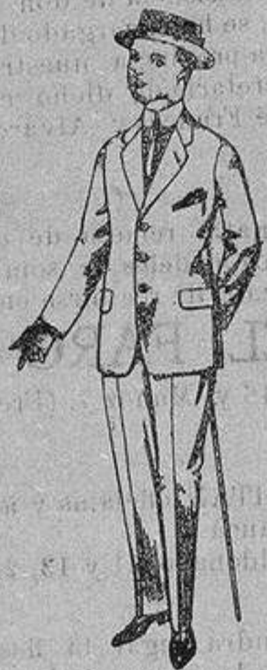
Trajes de lanilla, vi-cuña, etc. para juven-citos de 15 a 16 años. De ptas. 17 a 48

Camisería, Géneros de Punto, Corbatería, Guantería, Sombrerería, Zapatería, Paraguas, Bastones y Artículos de Viaje.