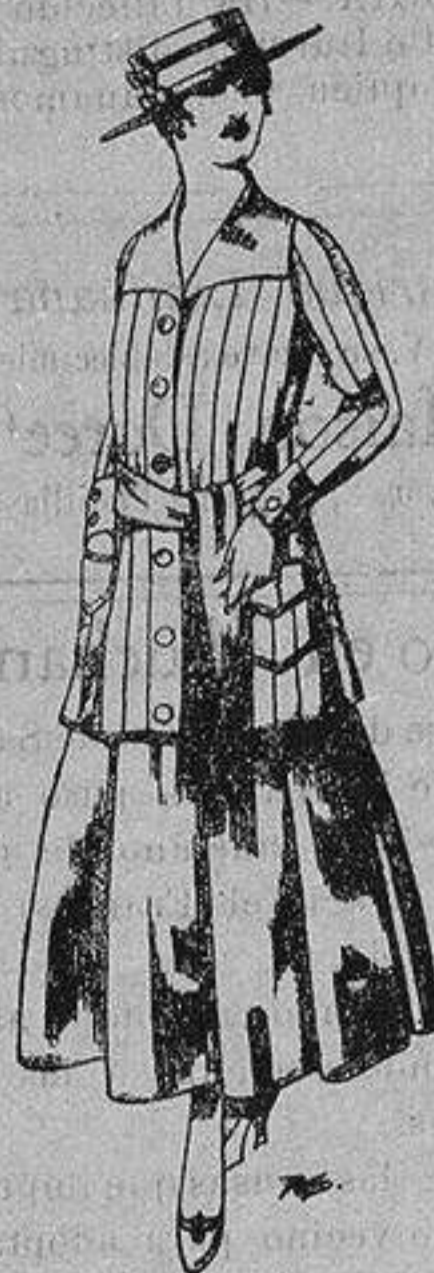
Paletot de tricof de seda colores lisos A ptas. 39