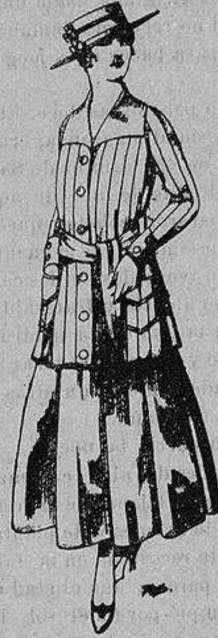
Paletot de tricof de seda colores lisos A ptas. 39