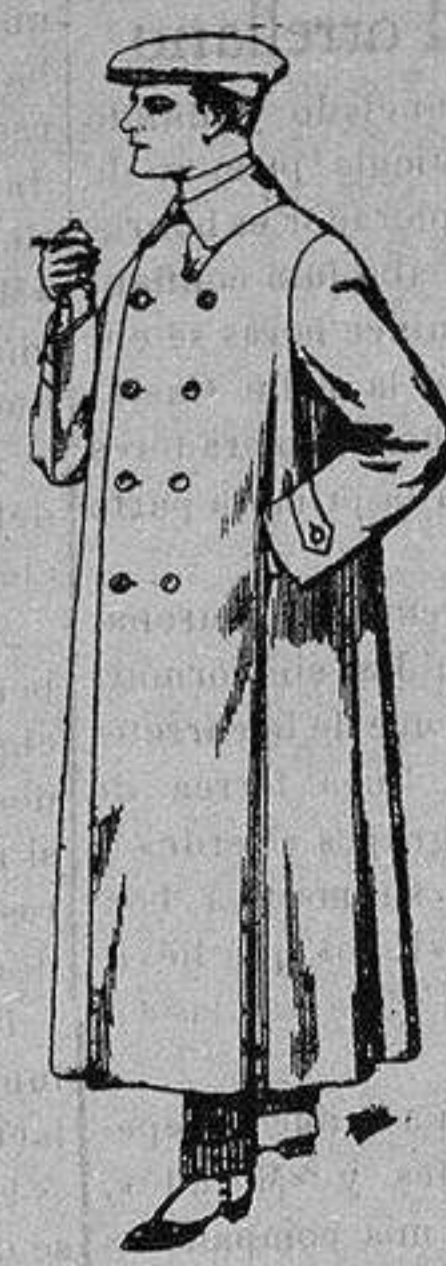
Guardapolvos de dril crudo o gris De ptas. 12'50 a 30