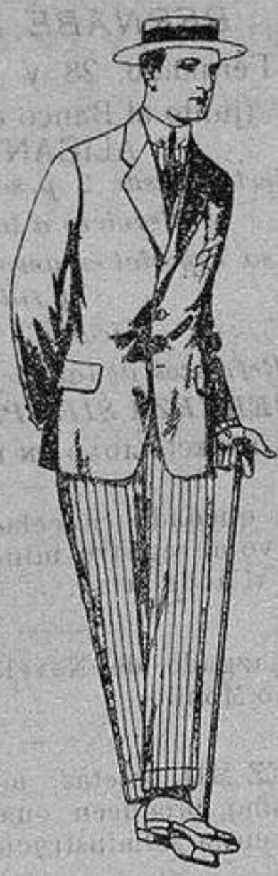
Trajes de alpaca negra De ptas. 32 a 50

Madrid, Barcelona, Alicante, Almería, Bilbao, Cádiz, Cartagena, Gijón, Granada Málaga, Palma de Mallorca, Santander, Sevilla, Valencia, Valladolid y Zaragoza.