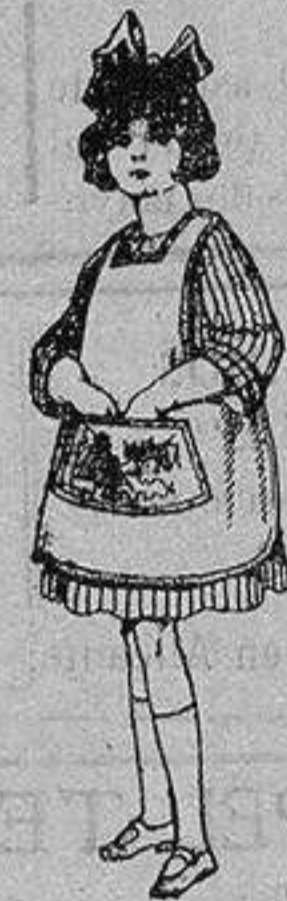
Delantal de dril color bedge De ptas. 3 a 7

Precio Fijo - Ventas al contado Pídase el Catálogo General