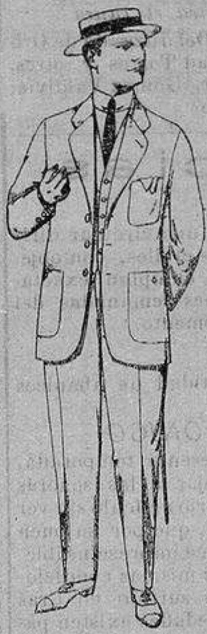
Trajes de dril crudo o kaki De ptas. 10 a 35