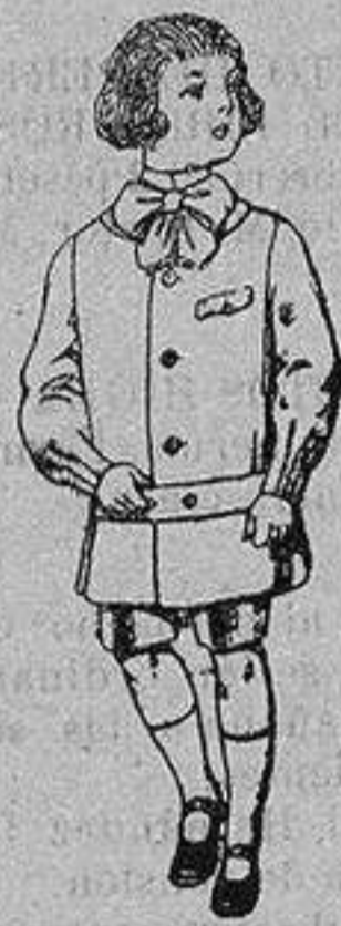
Trajes de lanilla en colores para niños de 4 a 9 años. De ptas. 9 a 18

Camisería, Géneros de Punto, Corbatería, Guantería, Sombrerería, Zapatería, Paraguas, Bastones y Artículos de Viaje.