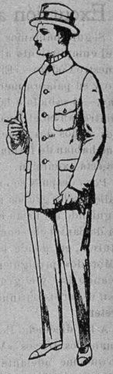
Guerreras de dril crudo, kaki o blanco De ptas. 7'50 a 10