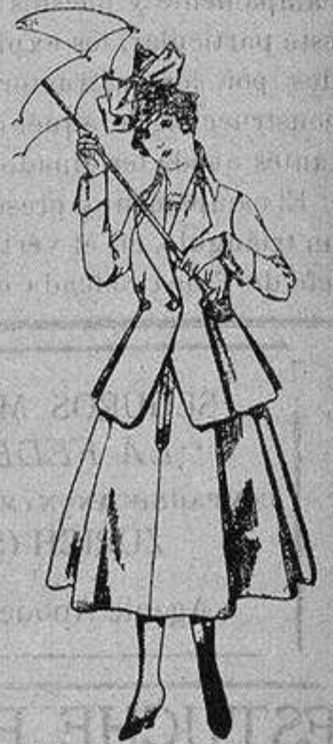
Trajes de lanilla negra azul y color, para juvenitas de 13 a 16 años. De ptas. 50 a 55