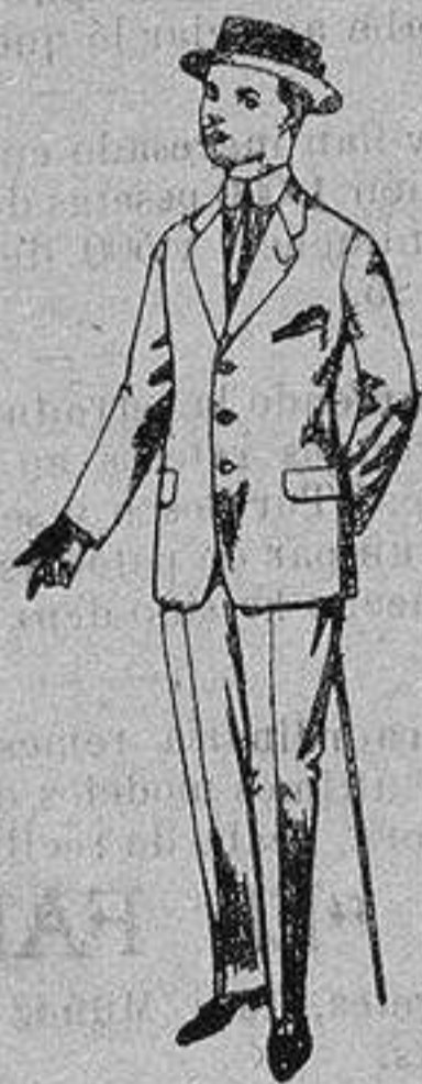
Trajes de lanilla, vicuña, etc. para juvenitos de 15 a 16 años. De ptas. 17 a 48