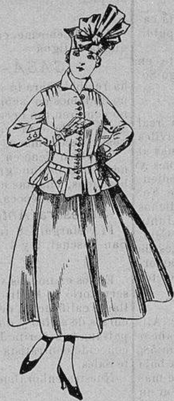
Trajes de lanilla, negra, azul y color. A ptas. 70