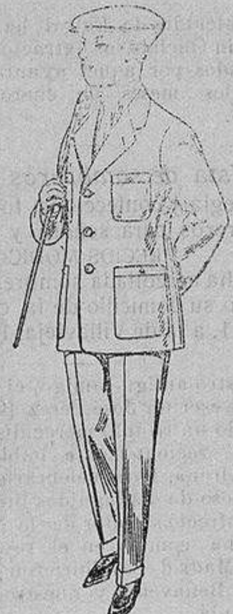
Trajes modelo sport, de dril listado, para jovencitos de 15 a 16 años. De ptas. 17 a 48.