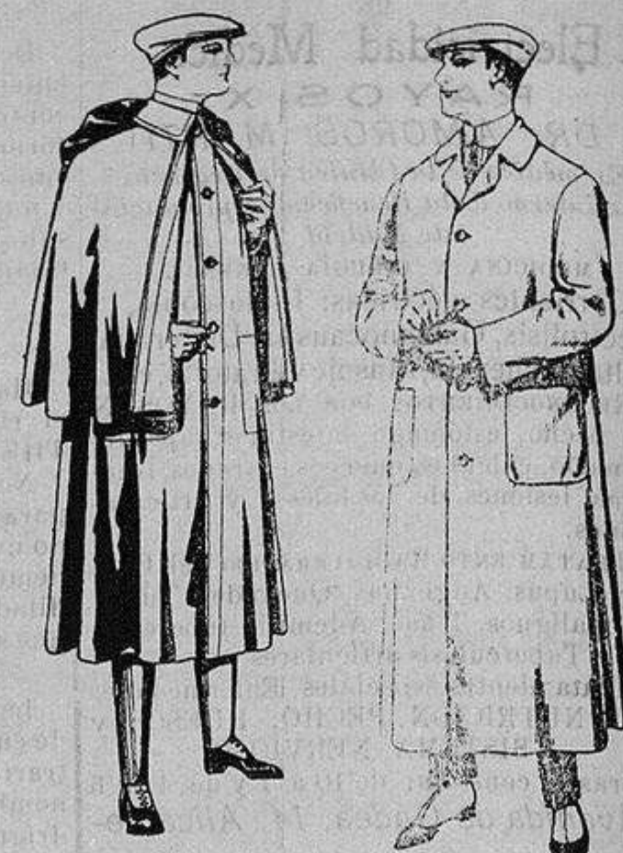
Impermeables forma mackferland, en negro y azul. De ptas. 55 a 100 Guardapolvos de dril igual al modelo De ptas 6 a 11