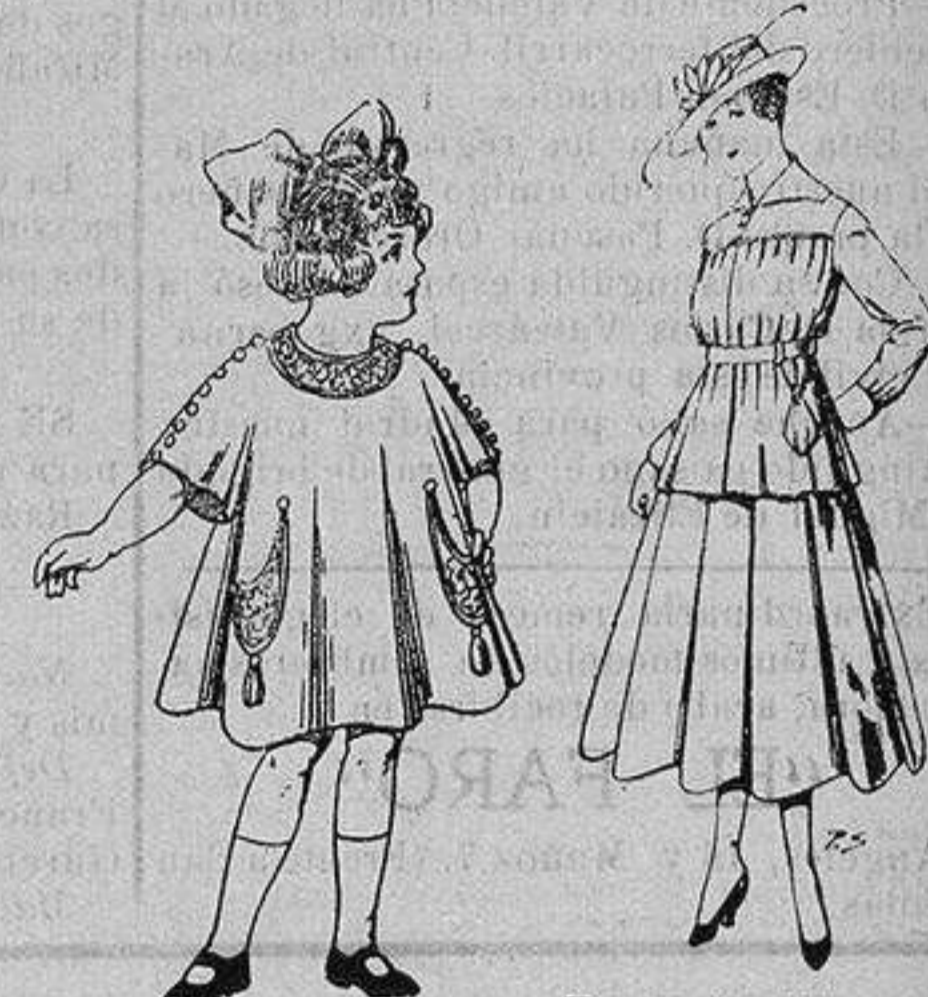
Vestidos de lanilla para niñas de 4 a 9 años. De ptas. 30 a 38 Trajes lanilla para jovencitas de 13 a 16 años. De ptas. 50 a 55

Precio Fijo - Ventas al contado Pídase el Catálogo General