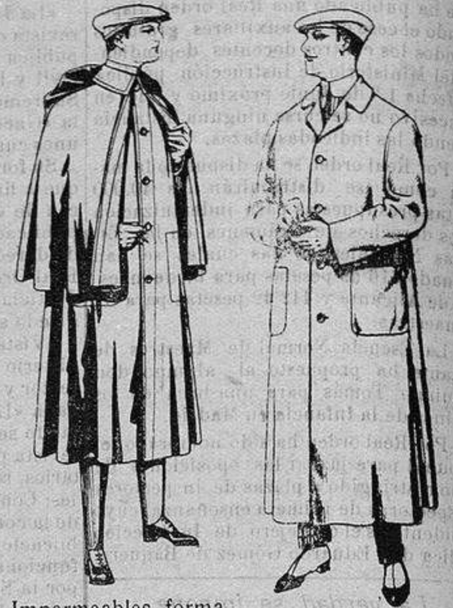
Impermeables forma mackferland, en negro y azul. De ptas. 55 a 100 Guardapolvos de dril igual al modelo De ptas 6 a 11