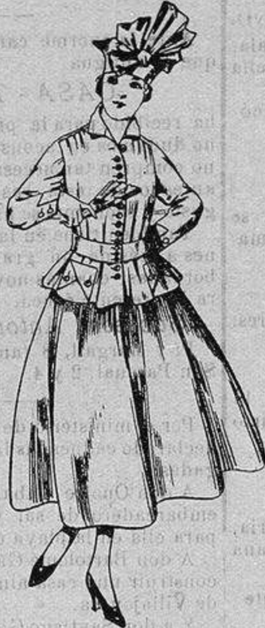
Trajes de lanilla, negra, azul y color. A ptas. 70