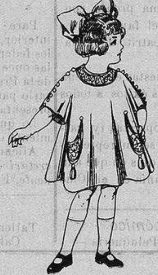
Vestidos de lanilla para niñas de 4 a 9 años De ptas. 30 a 38

Precio Fijo - Ventas al contado Pídase el Catálogo General