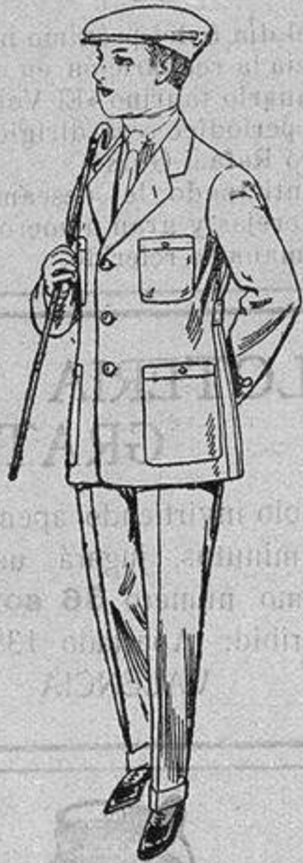
Trajes modelo sport, de dril listado para jovencitos de 15 a 16 años. De ptas. 17 a 48.