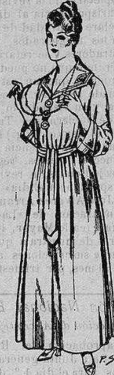
Batas de crepón, color cuello bordado De ptas. 10 a 15