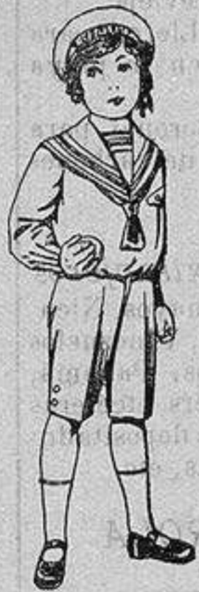
Trajes marinera de vicuña azul para niños de 4 a 9 años. De ptas. 6 a 20

Camisería, Géneros de Punto, Corbatería, Guantería, Sombrerería, Zapatería, Paraguas, Bastones y Artículos de Viaje.