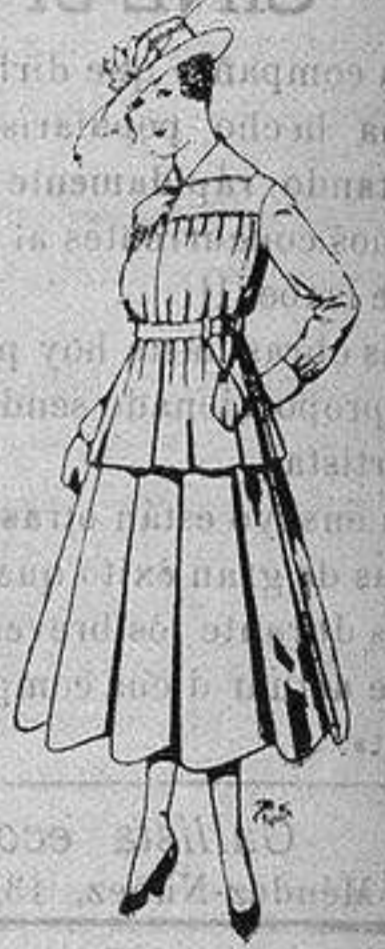
Trajes lanilla para jovencitas de 13 a 16 años. De ptas. 50 a 55