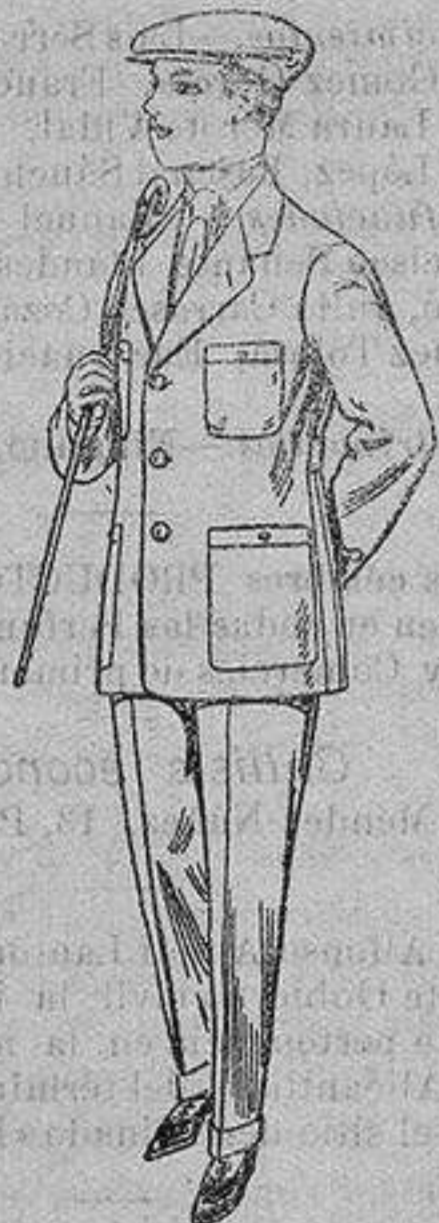
Trajes modelo sport, de dril listado, para jovencitos de 15 a 16 años. De ptas. 17 a 48.