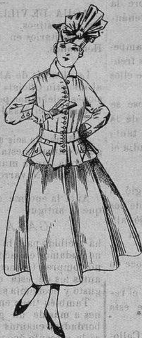
Trajes de lanilla, negra, azul y color. A ptas. 70