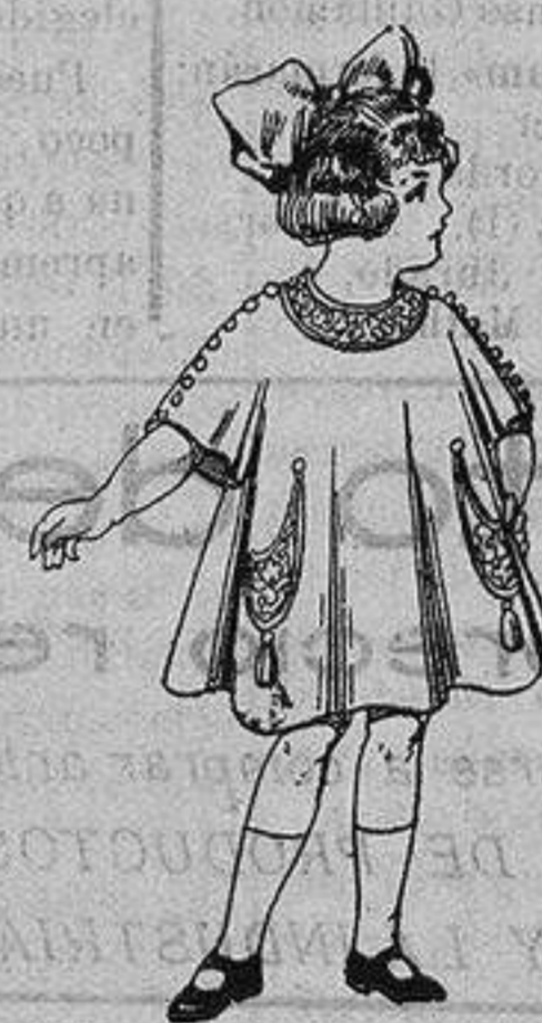
Vestidos de lanilla para niñas de 4 a 9 años De ptas. 80 a 38

Precio Fijo - Ventas al contado Pídase el Catálogo General