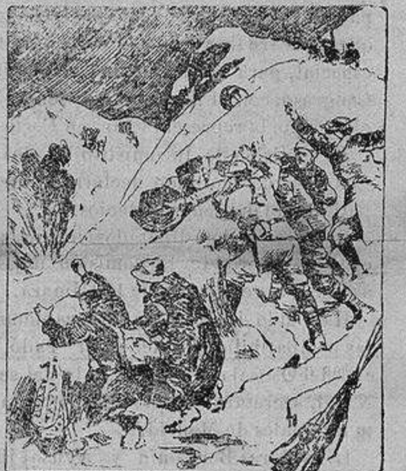
Uno de los medios que emplean austro-húngaros e italianos para combatir, consiste en precipitar sobre las posiciones enemigas barriles y trineos cargados de explosivos.