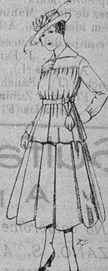
Trajes lanilla para jovencitas de 13 a 16 años. De ptas. 50 a 55