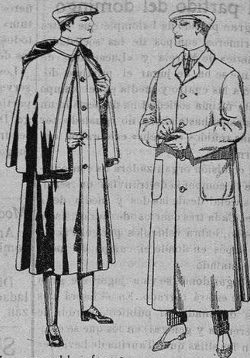
Impermeables forma mackferland, en negro y azul. De ptas. 55 a 100