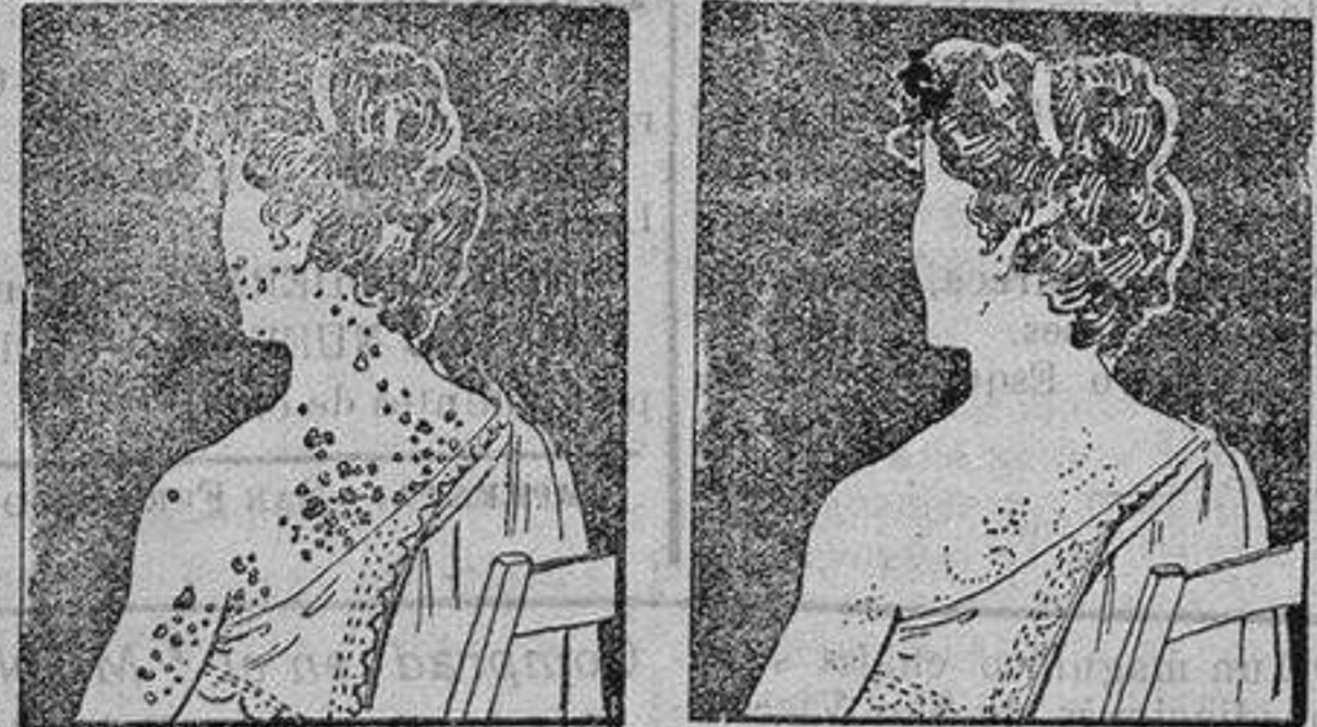
Antes de la Curación. Después de 15 días de tratamiento.

Para todas las Enfermedades de la PIEL, LLAGAS de las PIERNAS, ARTRITISMO, REUMATISMO, GOTA, DÓLORES, etc., etc.