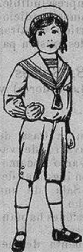
Trajes marinera de vicuña azul para niños de 4 a 9 años. De ptas. 6 a 20

Camisería, Géneros de Punto, Corbatería, Guantería, Sombrerería, Zapatería, Paraguas, Bastones y Artículos de Viaje.