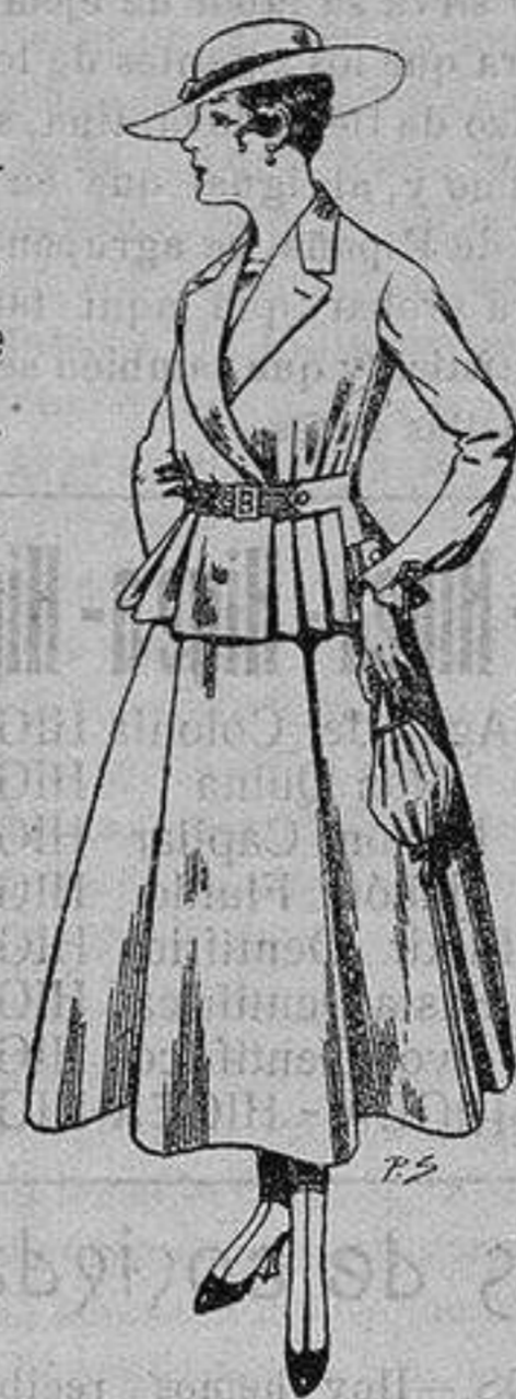
Trajes de lanilla para Señora. A ptas. 70