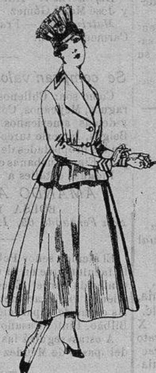
Trajes de lanilla para Señora. A ptas. 80