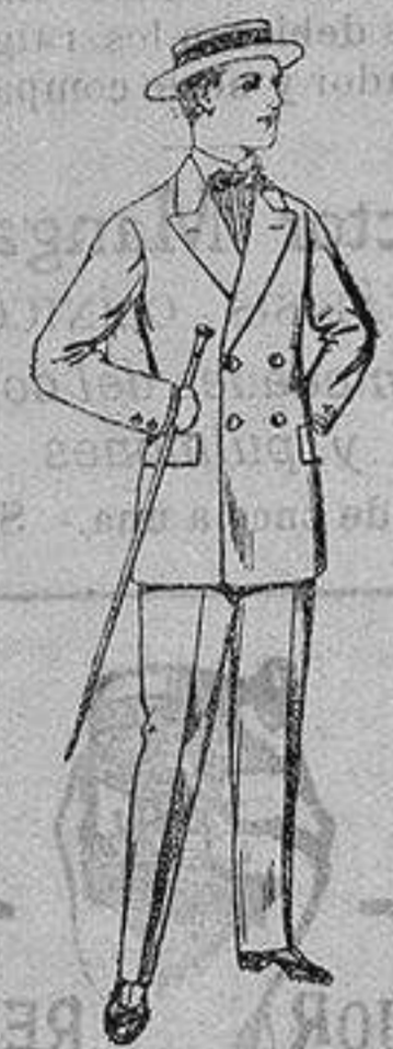
Trajes de lanilla, para jovencitos de 10 a 16 años. De ptas. 17 a 48