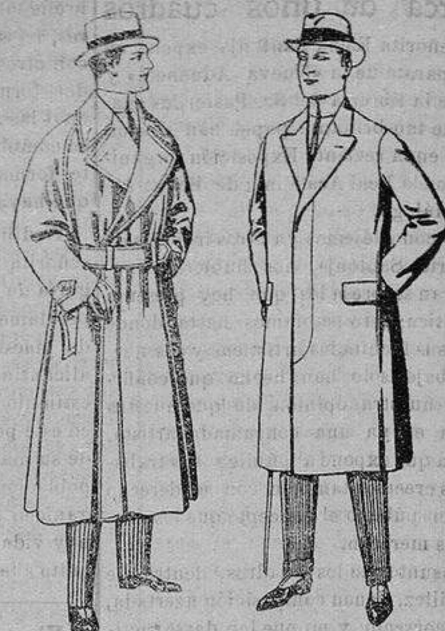
Gabanes impermeabilizados en color beige. De ptas. 65 a 110 Pardesus de melton o vigonia. De ptas. 25 a 100