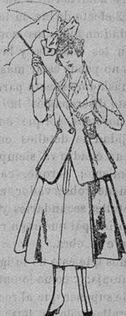
Trajes de lanilla para jovencitas de 13 a 16 años. De ptas. 53 a 55

Camisería, Géneros de Punto, Corbatería, Guantería, Sombrerería, Zapatería, Paraguas, Bastones y Artículos de Viaje.