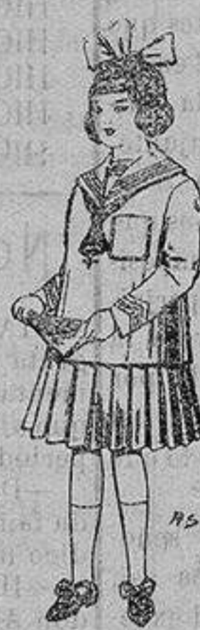
Trajes de lanilla para niñas de 4 a 12 años. De ptas. 32 a 40