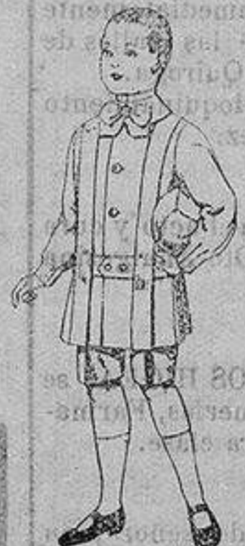
Trajes de lanilla para niños de 4 a 9 años. De ptas. 12 a 31