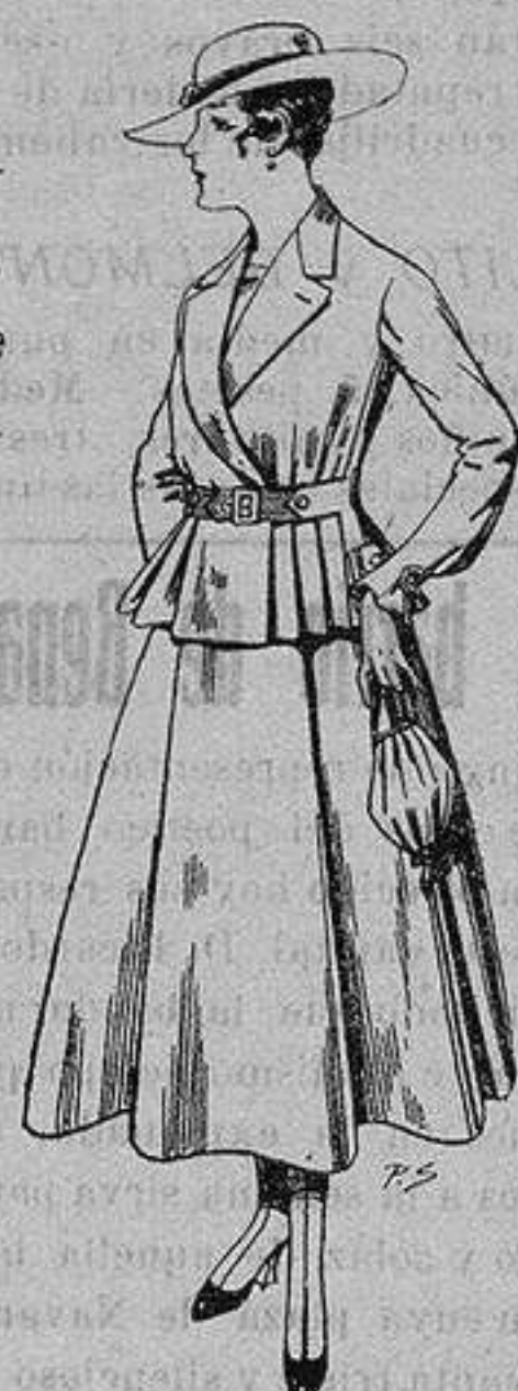
Trajes de lanilla para Señora A ptas. 70