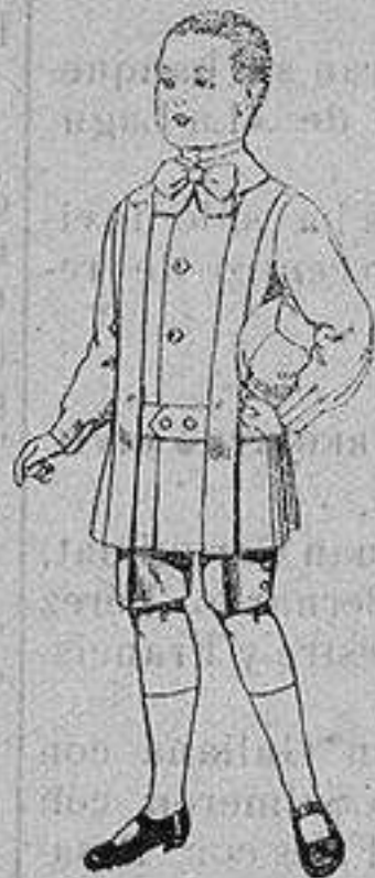
Trajes de lanilla para niños de 4 a 9 años De ptas. 12 a 31