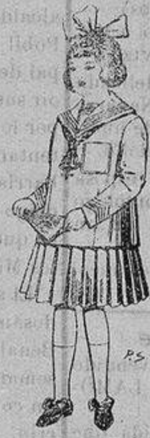
Trajes de lanilla para niñas de 4 a 12 años De ptas. 32 a 40