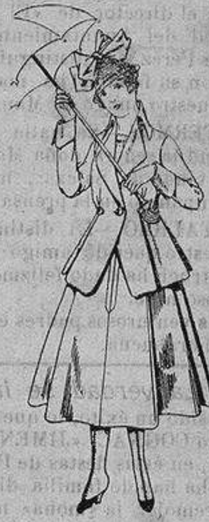
Trajes de lanilla para jovencitas de 13 a 16 años De ptas. 53 a 55

Camisería, Géneros de Punto, Corbatería, Guantería, Sombrerería, Zapatería, Paraguas, Bastones y Artículos de Viaje.