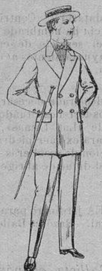
Trajes de lanilla, para jovencitos de 10 a 16 años. De ptas. 17 a 48