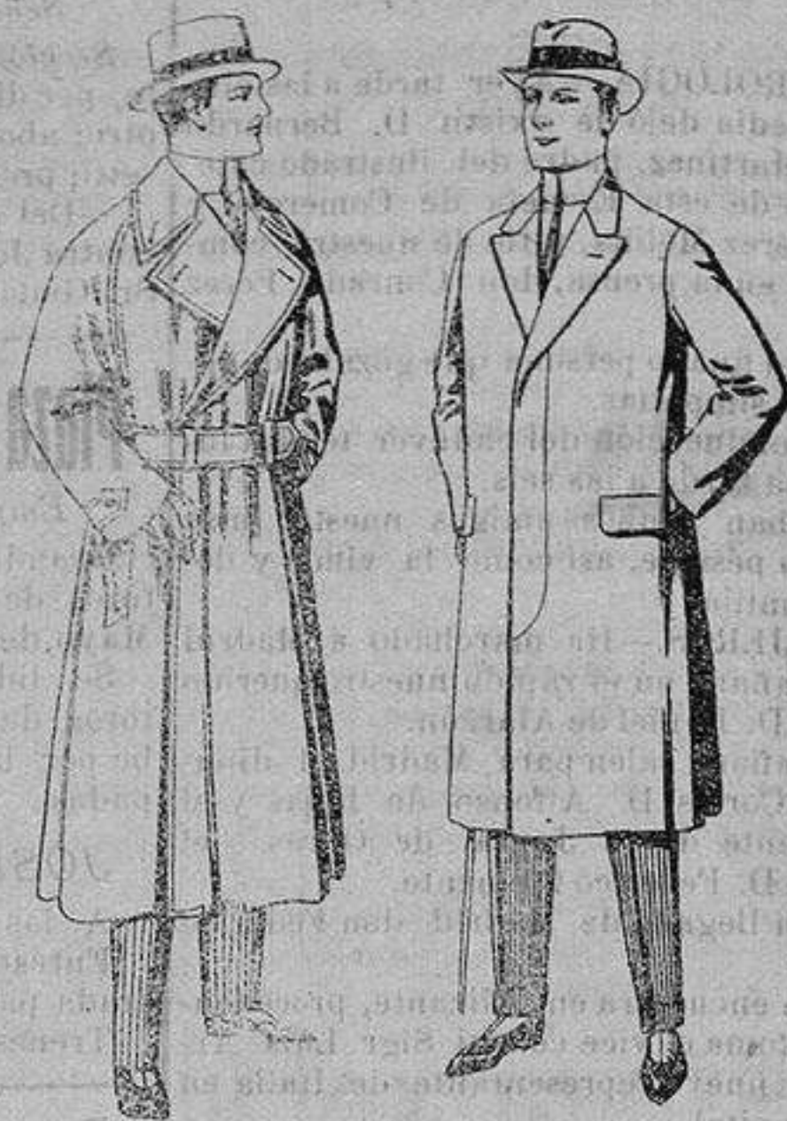
Gabanes impermeabilizados en color beige. De ptas. 65 a 110 Pardessus de melton o vigonia De ptas. 25 a 100