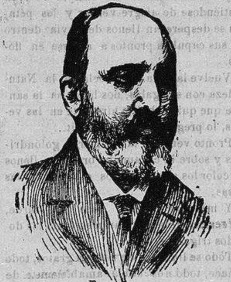
Sr. Torres Quevedo

lentos del Sr. Torres Quevedo, S. M. impuso a éste la medalla, pronunciando después el laureado un notable discurso, en el cual puso de manifiesto su extraordinaria modestia, solo comparable con su gran valía.