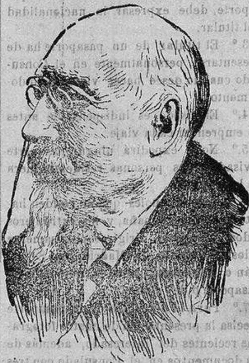
D. José Echegaray