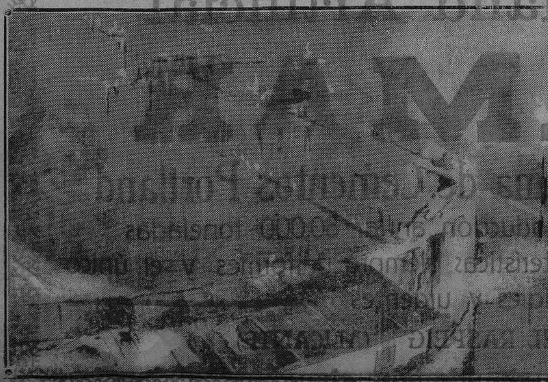
Aspecto del Teatro Novedades cuando el incendio estaba en todo su apogeo