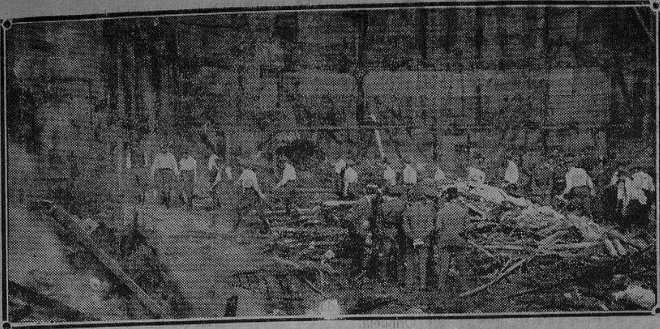
Soldados del regimiento de León ayudando a los bomberos en los trabajos de desescombro durante la busca de cadáveres en el incendio del Teatro Novedades