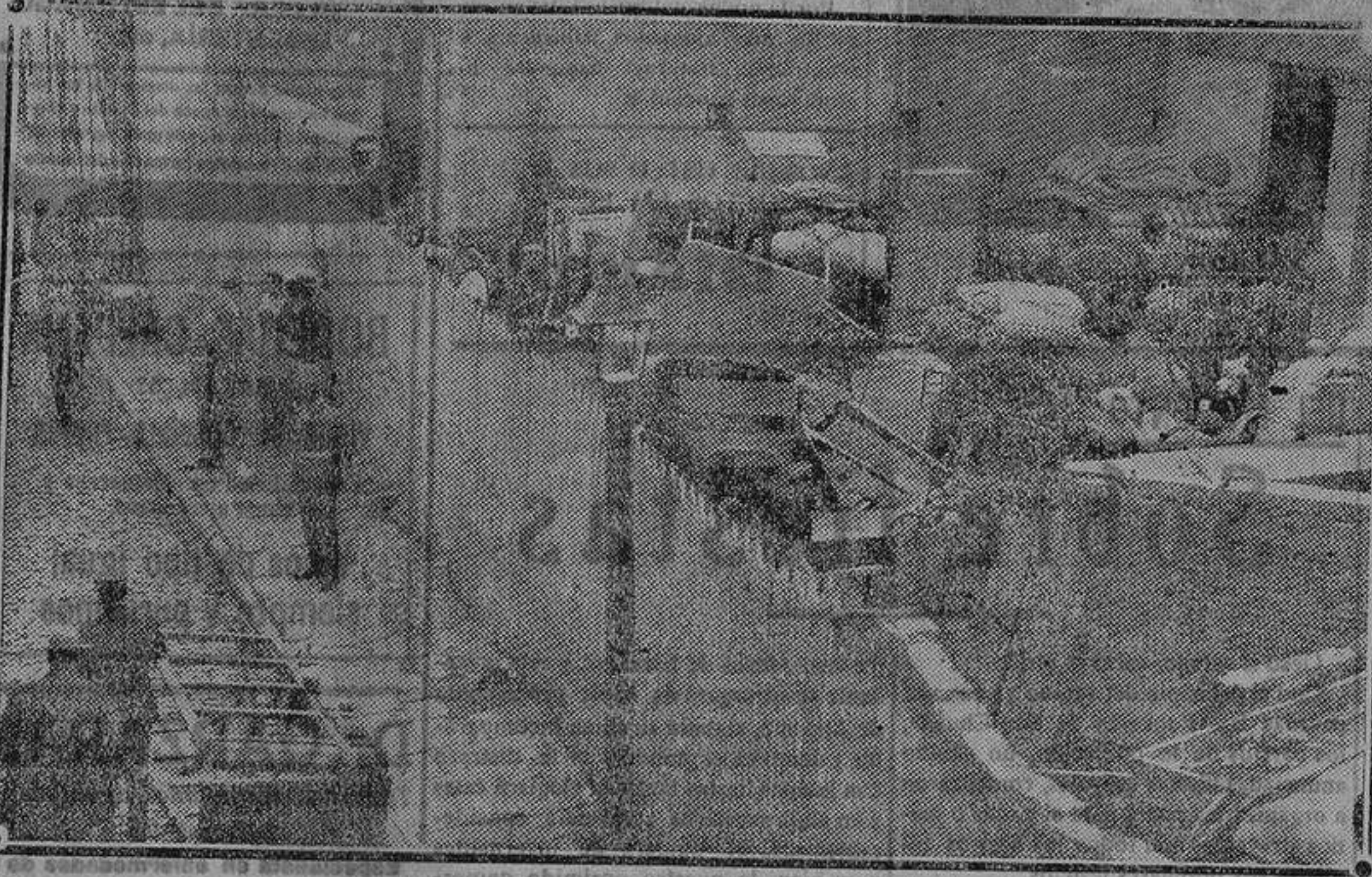
Solar de la calle de las Velas, contigua al teatro, donde se almacenaron los muebles de las casas desalojadas