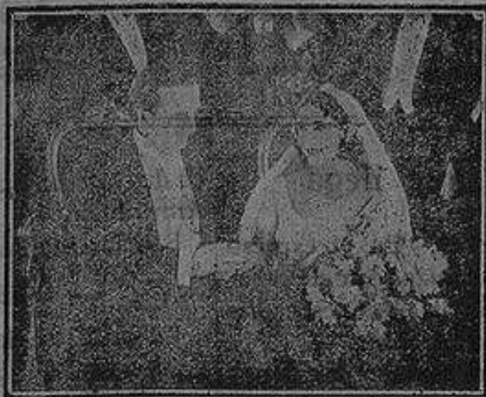
Una escena de la interesante película

trágica repetición del cataclismo que siglos atrás sepultara la ciudad admirada por Flavio de Sangro. Mario despertó aterrado y Lucila, estechándolo contra su pecho lo sacó de la casa para unirse al tropel que huía de la lluvia de fuego, cenizas y piedras llegando tras un calvario de dolor a «Villa Blanca». Indemne estaba Mario; pero Lucila en el exodo de horror, abrasada por los resplandores de hoguera, sus pupilas se cegaron. En el alma de la huérfana no desmayó la fe y fué a ocultar el drama de sus ojos muertos en la villa de su madrina donde recibía cada día la visita consoladora del niño tan querido. Pero un día dejó de ir Mario, porque su padre había vuelto. Más tarde, Flavio se enteró que Lucila había perdido la vista por salvarle el hijo. Aquella noche no durmió De Sangro. A la mañana siguiente vió desfilar nutridas caravanas de peregrinos hacia el templo de la Virgen del Rosario, cuya festividad conmemoraba la iglesia aquel día y Flavio salió como un automata agregándose a la comitiva. Bajo las bóvedas del sacro recinto resonaban los murmullos de las plegarias. Rogaba Lucila y su madrina. Rogaban por la ciega todos los que sabían su desgracia. Y el milagro se hizo. En las pupilas veladas volvió a reinar la clara alegría del sol. Flavio, el escéptico, absorbió ante tal prodigio posternose... Era que en su alma ciega irrumpía la Verdad esplendorosa.