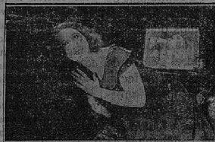
Episodio emocionante de "La huérfana de Pompeya"

olvidar ambos un no satisfecho amor. Una noche, las simietras amenazas del volcán desbordaron, esparciendo el terror y la muerte en muchos kilómetros alrededor en