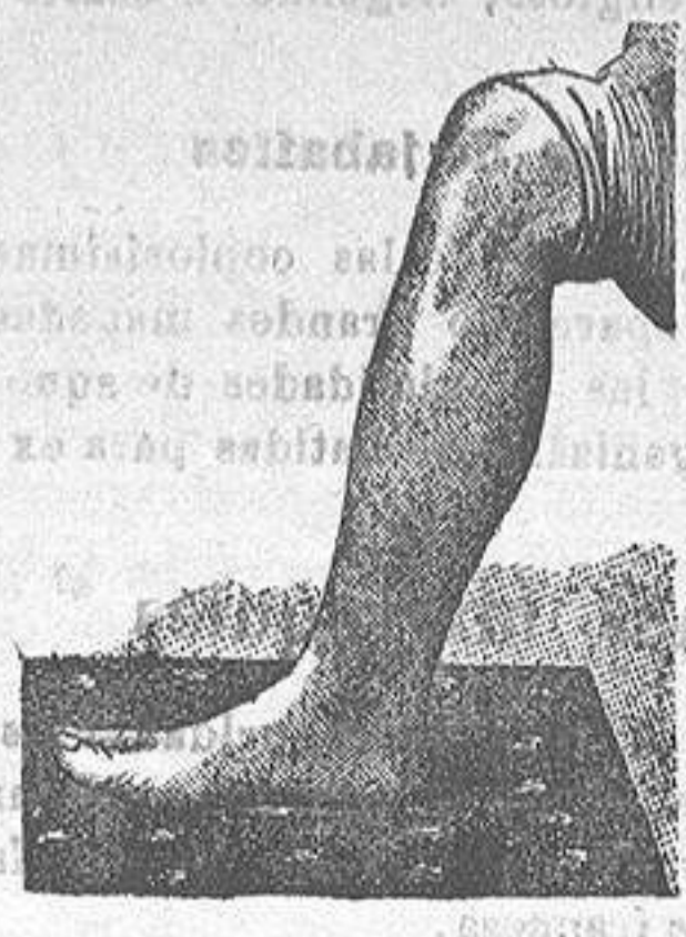
Después de la curación