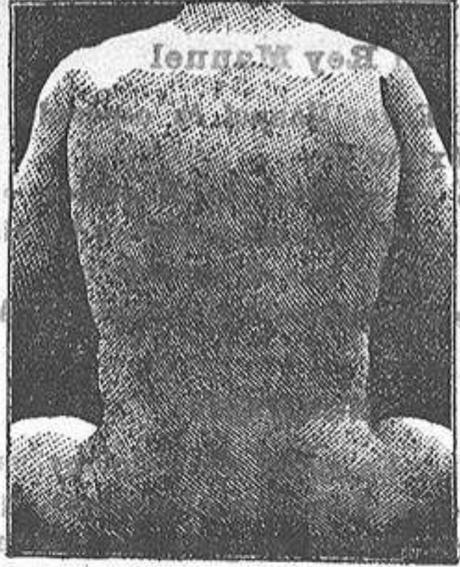
Después de la curación