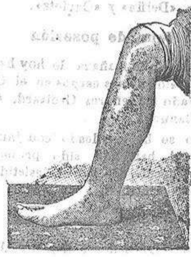
Después de la curación