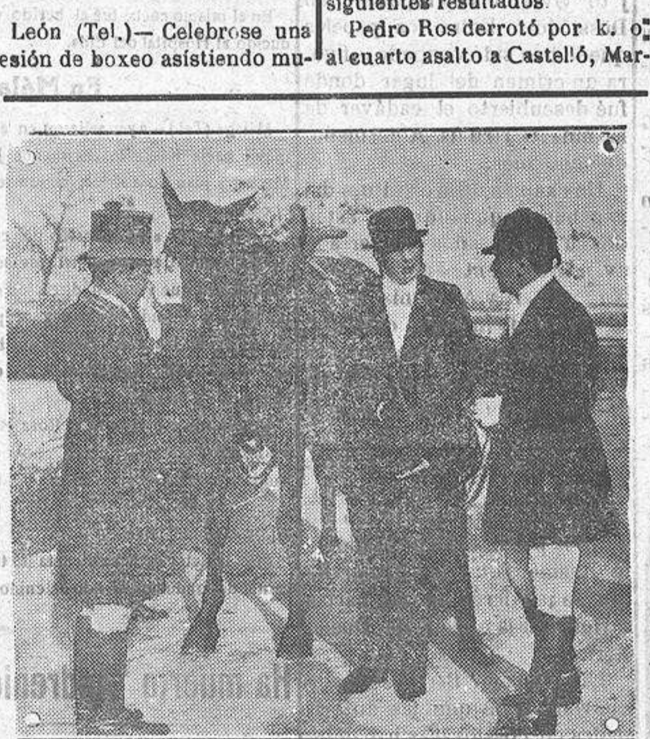
Su Majestad la Reina Victoria disponiéndose a tomar parte en la cena que se celebrará efectuada ayer en la Venta de la Rubia.

Especialista en enfermedades de la garganta, nariz y oídos. Tratamientos modernos de dichas enfermedades. Consulta de 11 a 1 BAILEN, 20 — ALICANTE