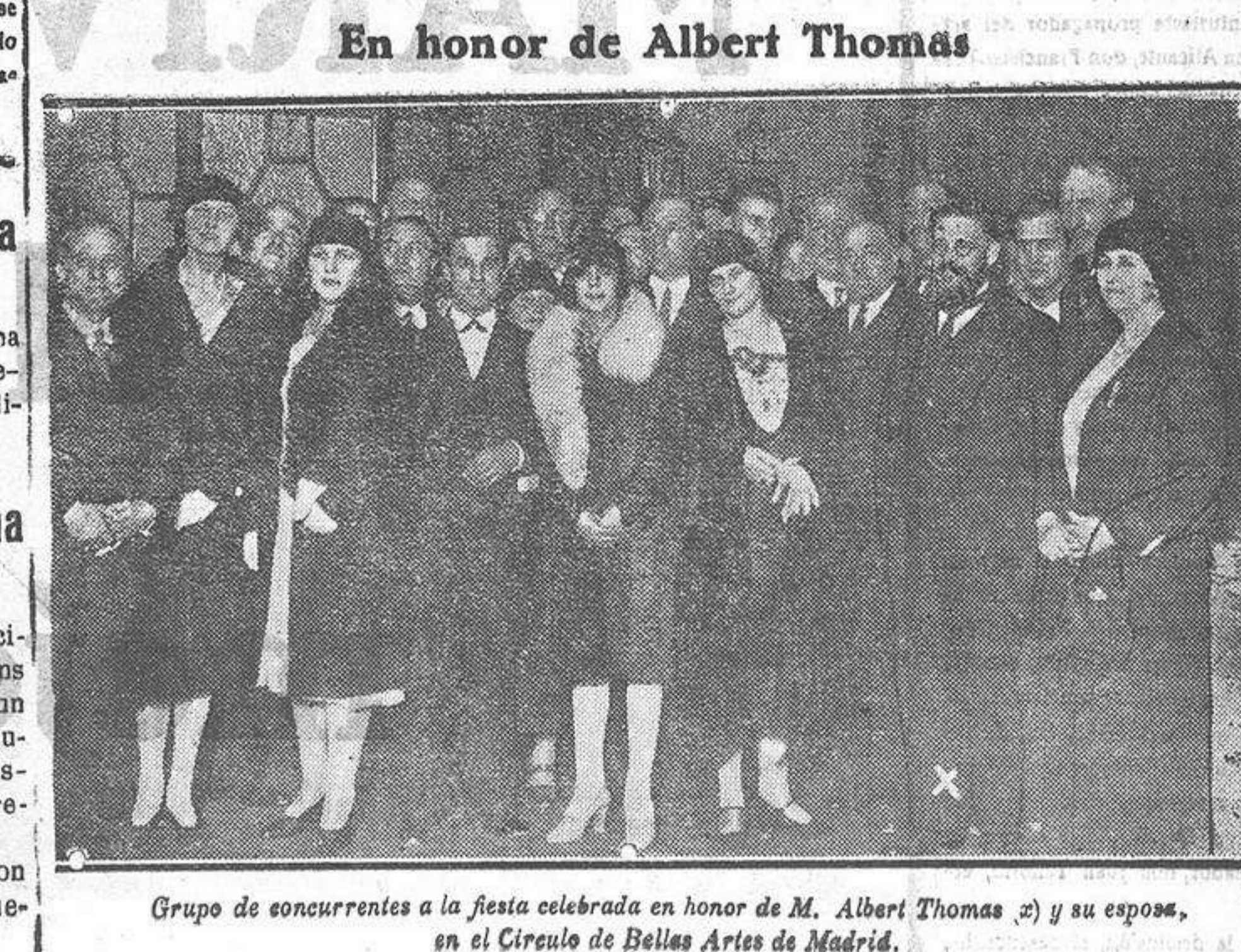
Grupo de concurrentes a la fiesta celebrada en honor de M. Albert Thomas y su esposa, en el Círculo de Bellas Artes de Madrid.