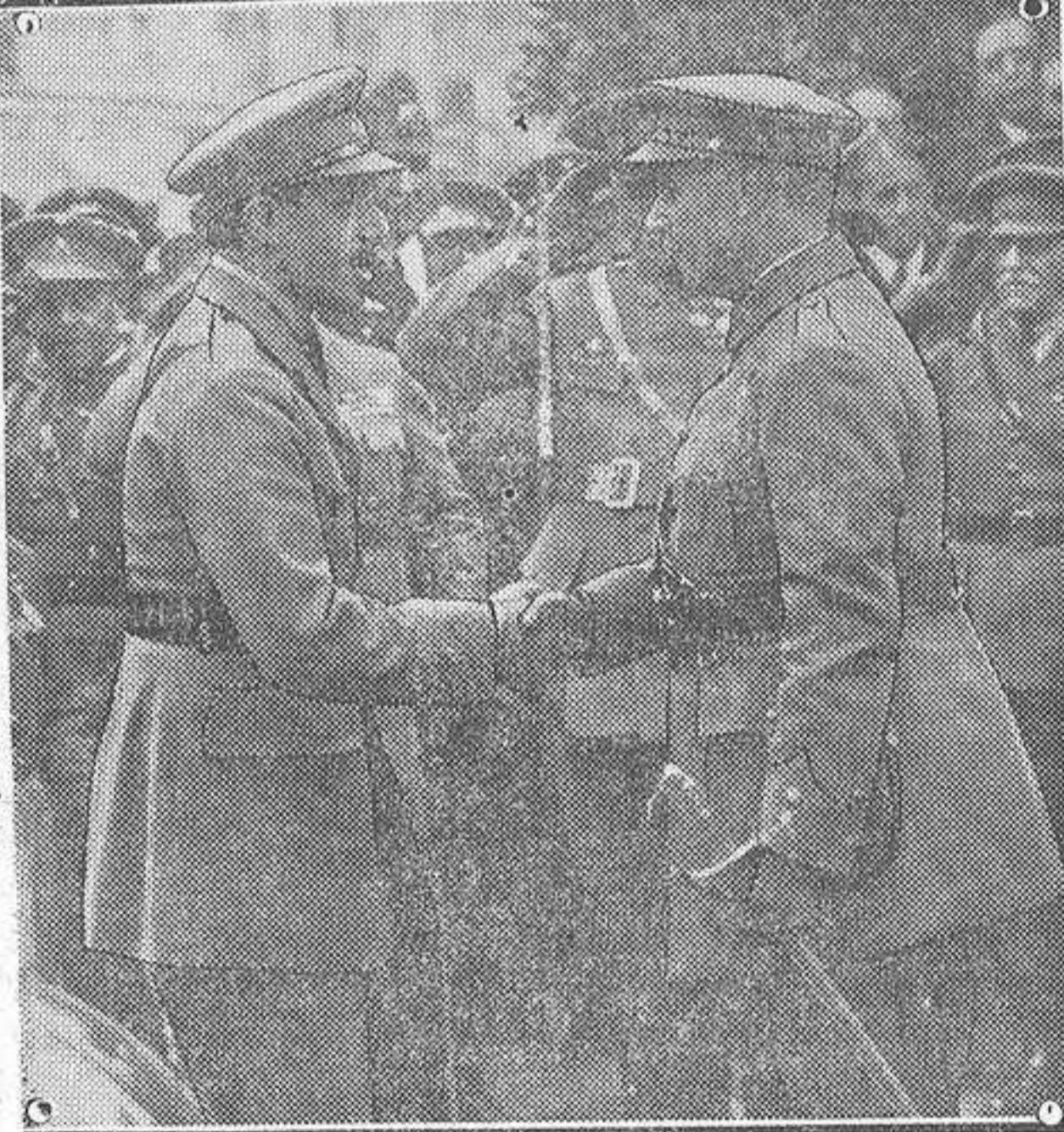
Su Majestad el Rey felicitando al general Saro durante el acto inaugural del grupo de casas para militares.

A continuación se llevaron cuanto dinero había en la casa. Al día siguiente hicieron otro registro en ésta por si había escondido más dinero. Regaron la casa con petróleo y le prendieron fuego. Este se inició en la habitación en que se encontraba la víctima, y el propósito de los criminales fué el de hacer desaparecer las huellas del crimen.