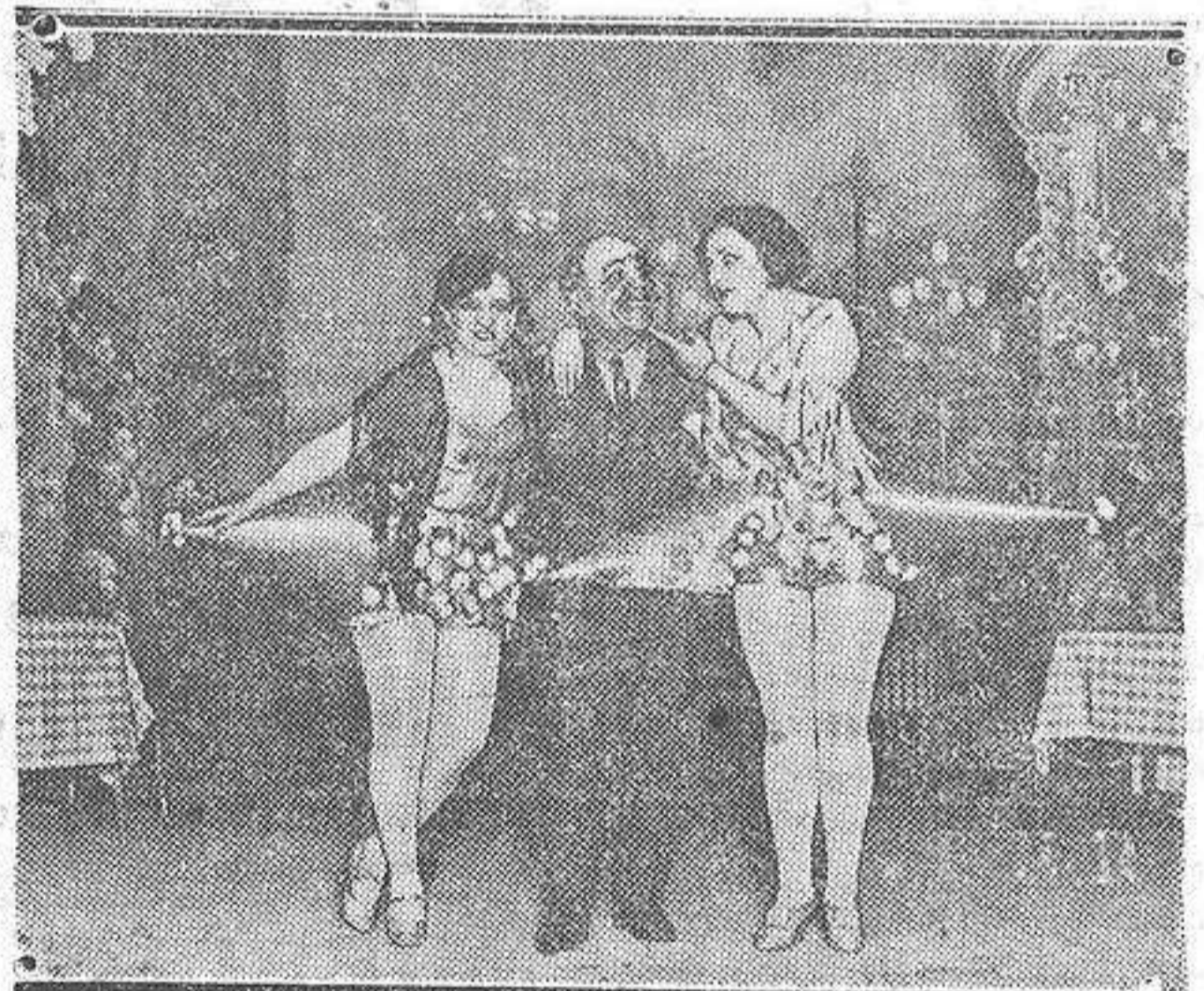
Una escena de la obra «Las campanas de la gloria», estrenada en el teatro Chueca de Madrid.