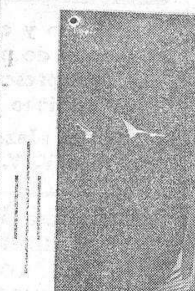
«El hero del idolo», cuadro simbólico del pintor boliviano Guzmán de Rojas.

raza para ser más exactos. Y nada gana con esa expatriación el arte americano, sin recibir tampoco ninguna utilidad el arte del viejo con tinente.