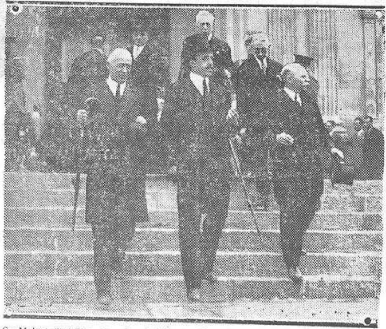
Sa Majestad el Rey, con el embajador de Francia saliendo de inaugurar las instalaciones francesas de la Exposición de Barcelona.