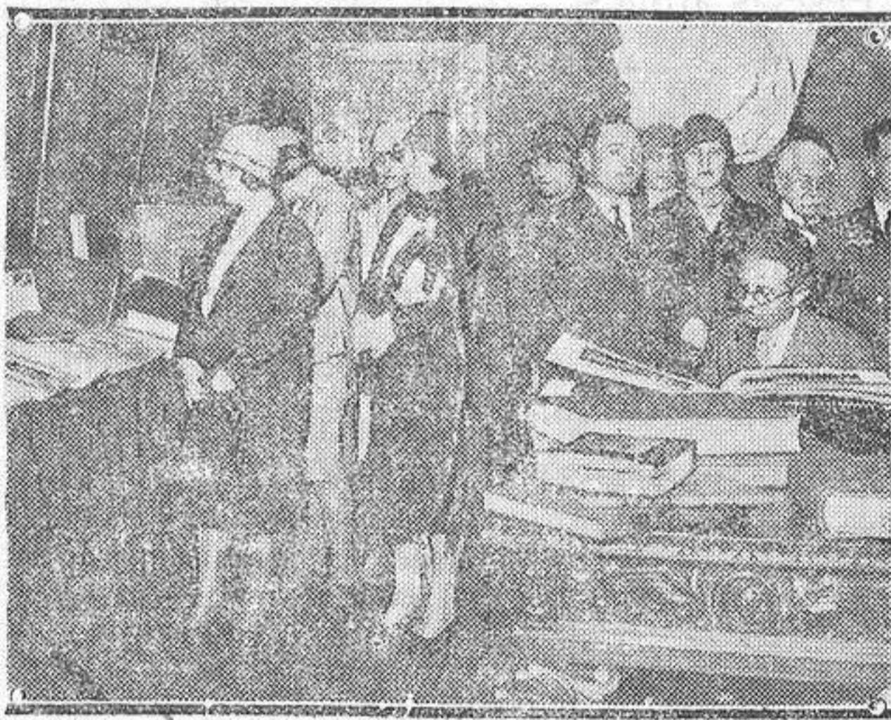
Apertura de la Exposición Internacional del Libro de Arte de España, acto celebrado en los salones de la Casa Inchausti de Madrid.

pendientes orientales de los Andes ecuatoriales. Muerto el enemigo sometieron su cabeza a una serie de operaciones que la reducen al tamaño de un puño.