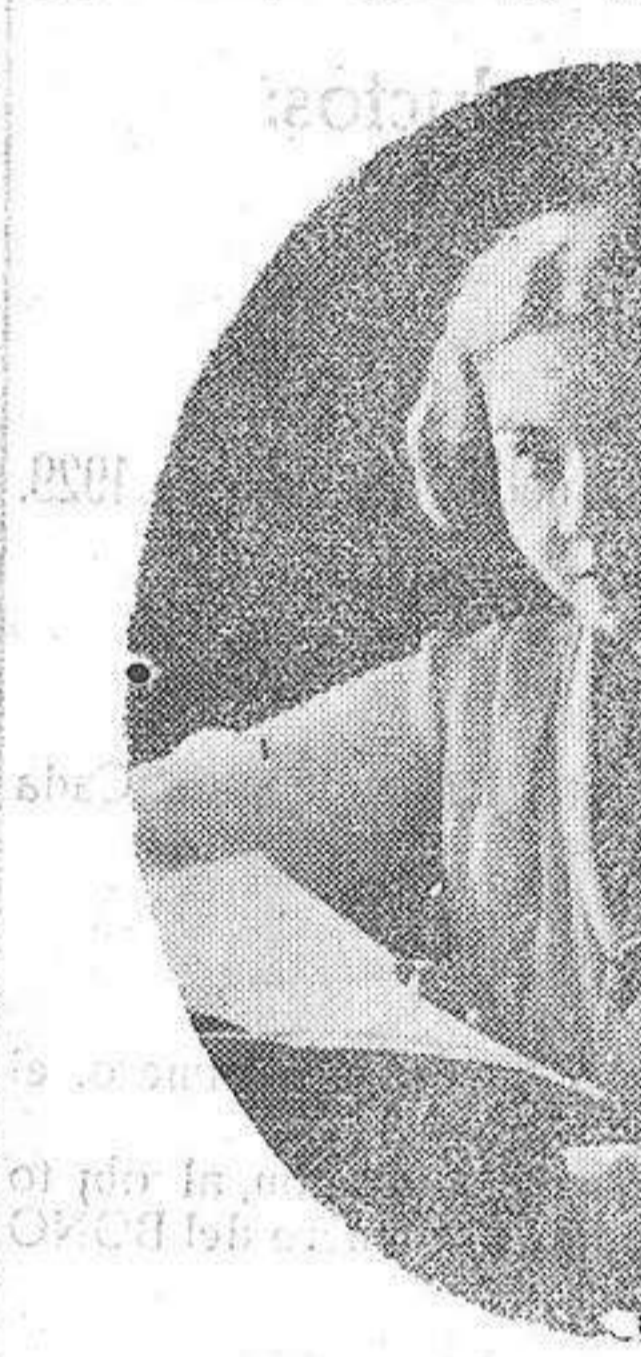
María Teresa de León Notable escritora y conferenciante

Cuando sobre el estrado hubo apagado su voz, otra ovación de aplausos, otorgados por la totalidad de los espectadores, fué, ahora sí, el premio a su femineidad e inteligencia. Entonces mi curiosidad le volvió a conecrirla. Pero tanta era aquella tarde la