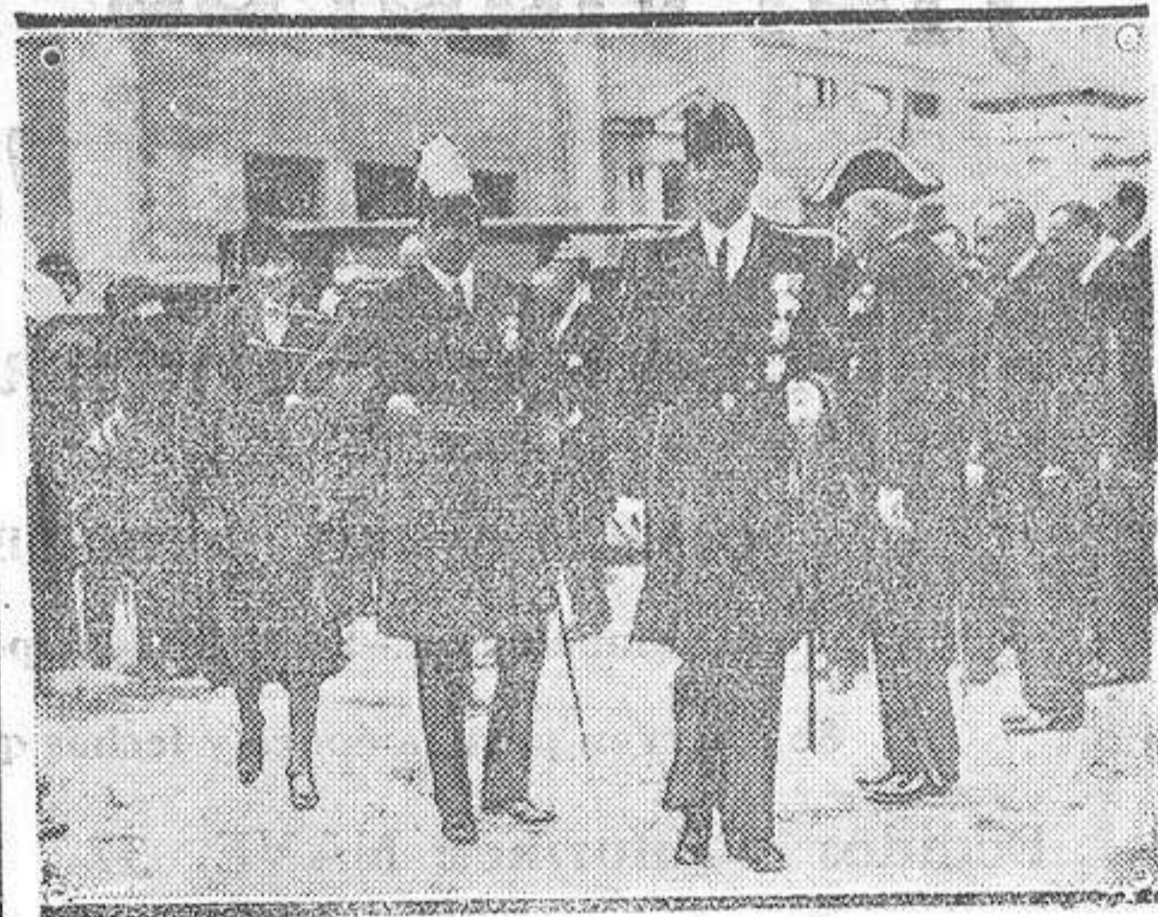
Sus Majestads, con el Príncipe Knud de Dinamarca, saliendo de inaugurar el pabellón danés de la Exposición de Barcelona