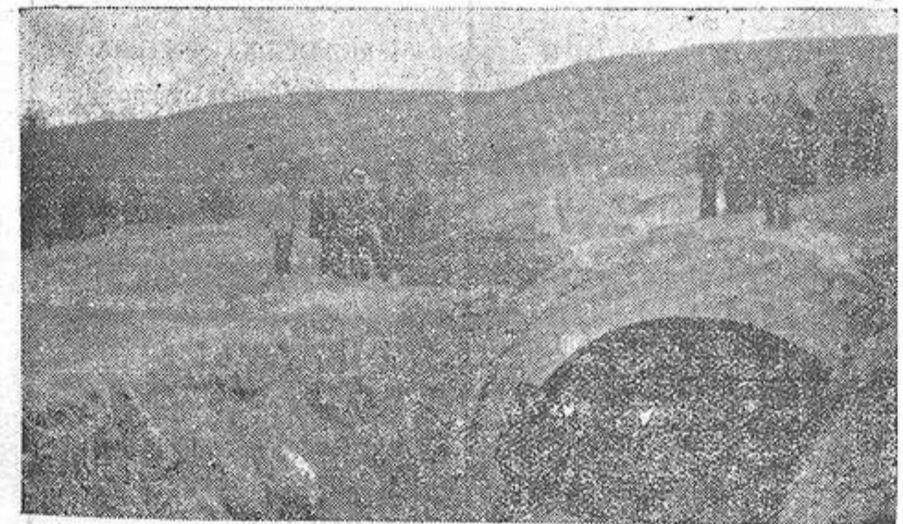
El túnel del Barranco del Paller, en el Maimó inaugurado el sábado