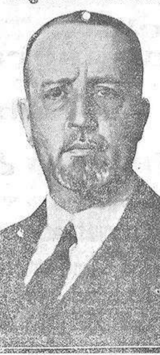
El conde Volpi di Misurata Eminent estadista italiano, que es actualmente huésped de España