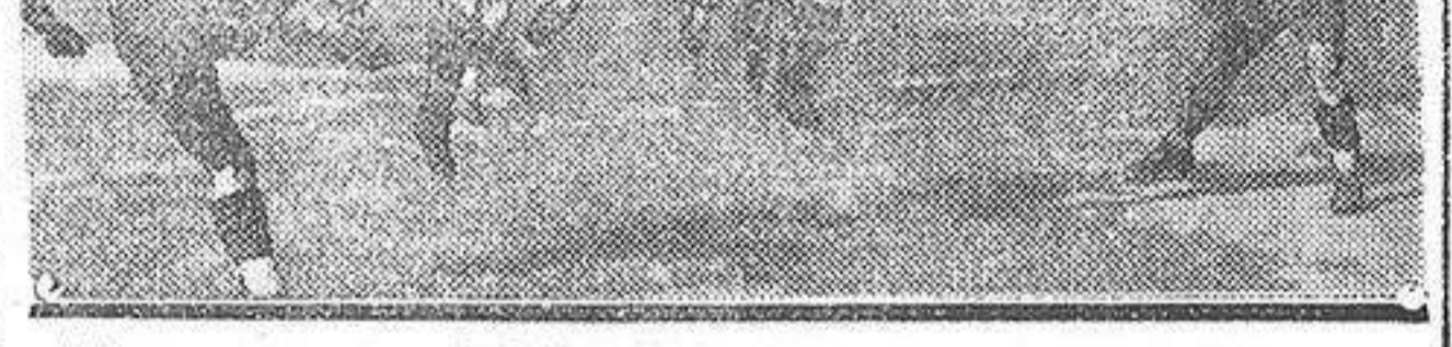
Un momento del partido jugado en Madrid entre los ednips del «Racing» madrileño y el «Iberia» de Zaragoza.

EL MADRID VENCIDO POR LA REAL SOCIEDAD. San Sebastián (Tel).—De salida