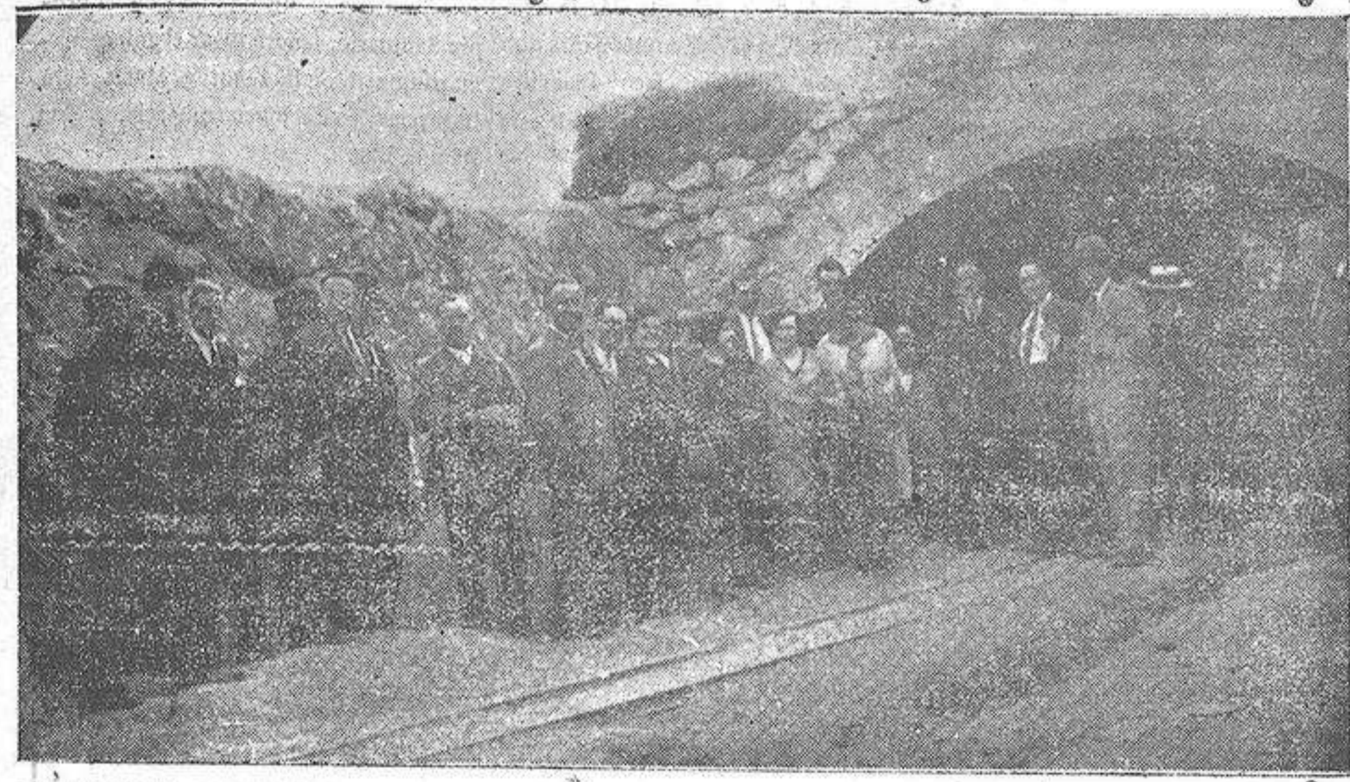
Grupo de invitados al penetrar en el túnel cuyas obras iniciadas se inauguraron el sábado

El éxito de la perforación con un Sumper en la magnificencia de las ágape, espléndidamente servido por solitarias barrancadas.