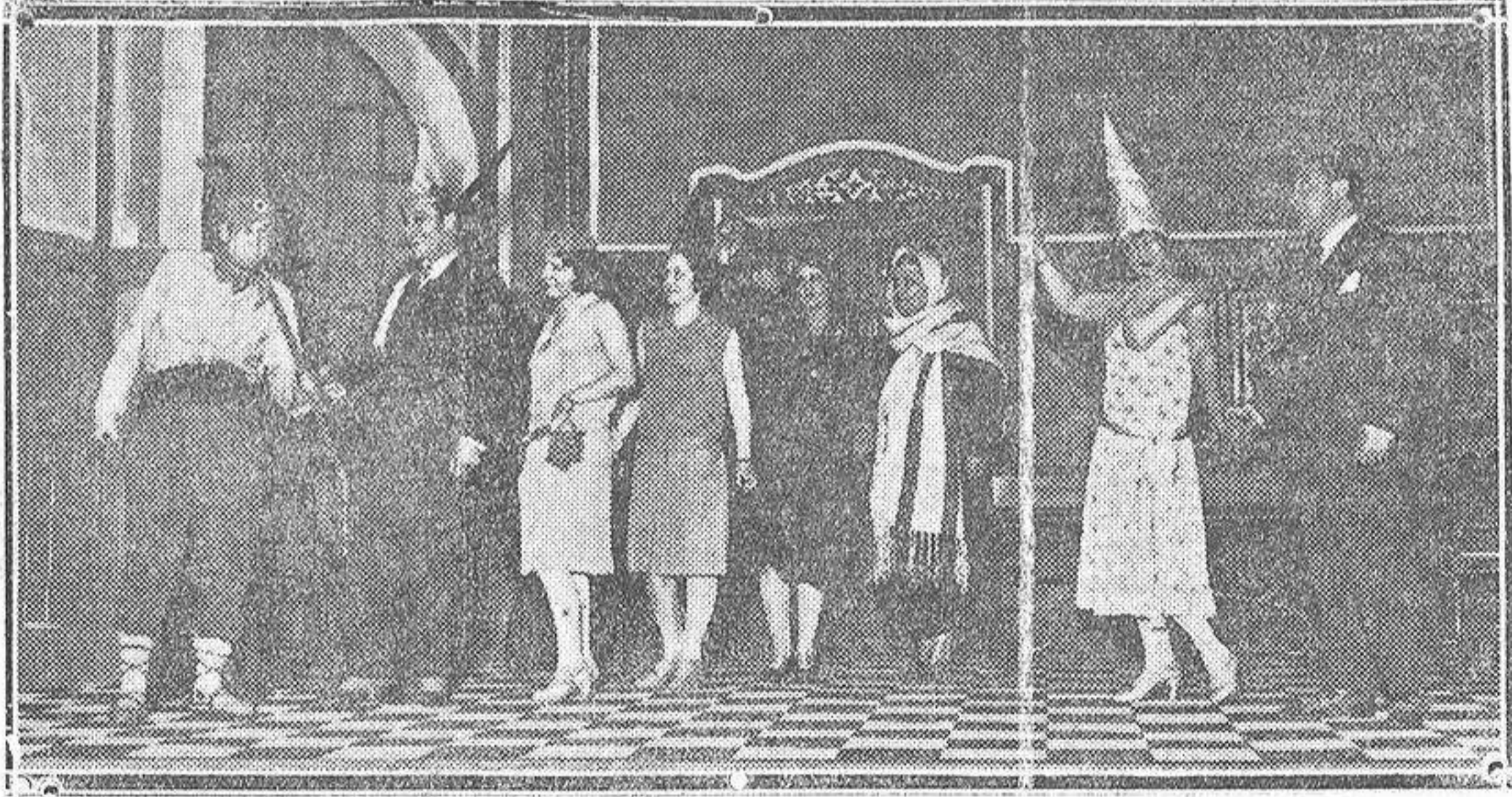
«Una mano suave», obra que se estrenó en el teatro de la Zarzuela, de Madrid, últimamente.