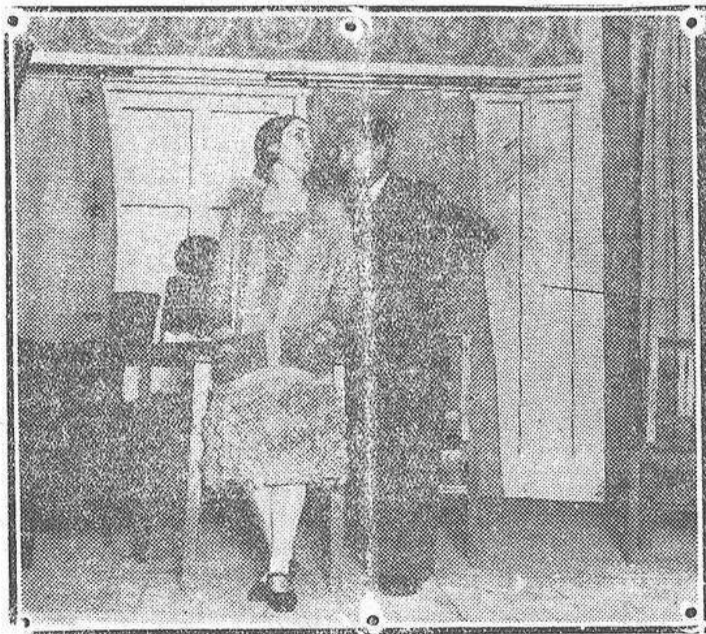
Una escena de la obra de Muñoz Seca «El sofá, la araña, el espejo y la hija de Palomeque», estrenada en el Cómico, de Madrid, con éxito antecesor.