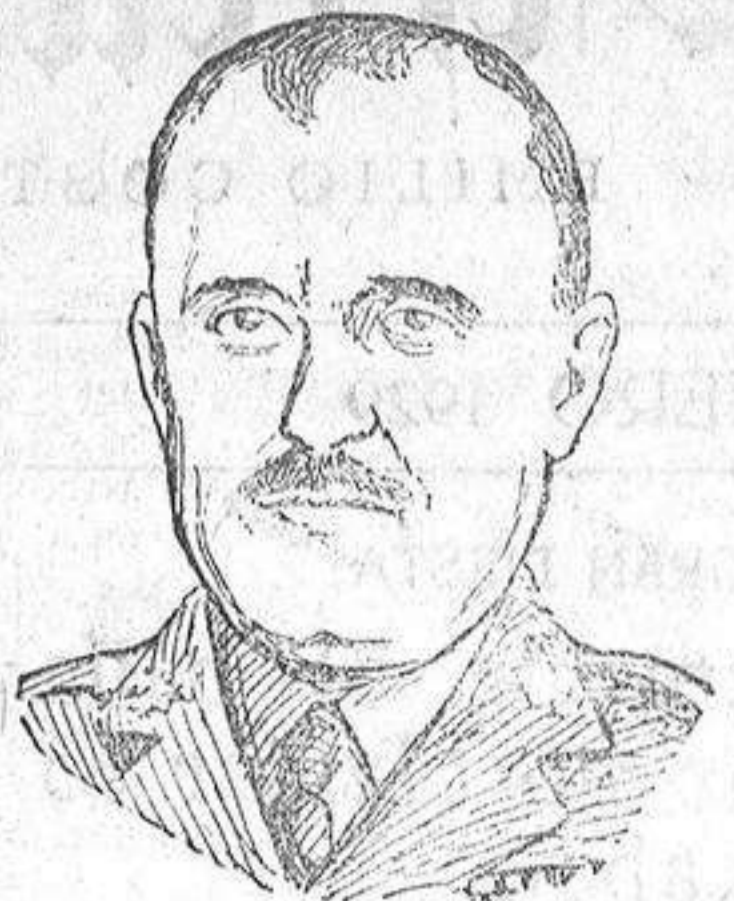
El comisario superior Conde de Jordana que se halla enfermo de algún cuidado