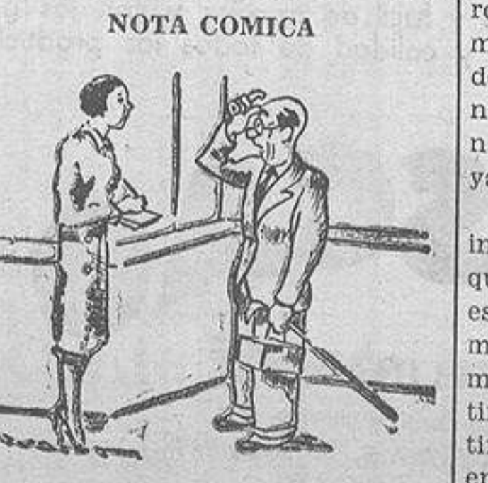
—Desaba comprar un sombrero. —En el segundo piso, sección de antigüedades.

Heca no muchos años, a partir del año 14, se repitió ya mucho lo de la chifadura de Unamuno. La calificación, claro, las derchas y los gubernamentales. Pero al señor Unamuno no le quedaba más