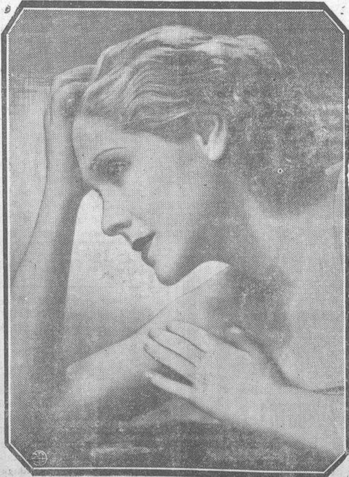
PREOCUPACIONES DE HOLLYWOOD

Las ovaciones con que la asamblea acogió los elocuentes discursos de los tres oradores fueron indescriptibles. Los aplausos, los vitores a Gasset, a Blasco, a Valencia, a Castellón y a Alicante duraron largo rato.