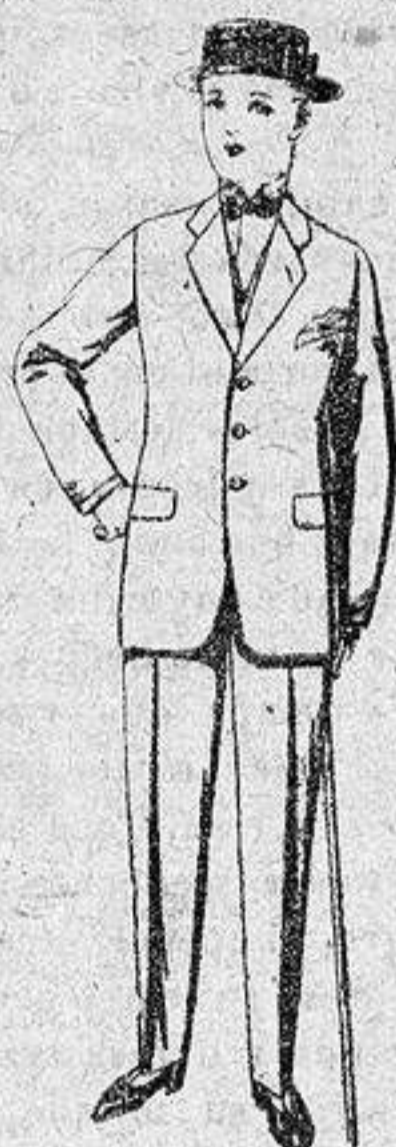
Trajes de lanilla melton, vicuña, etc., para jóvenes de 10 a 16 años, de 20 a 55 ptas.