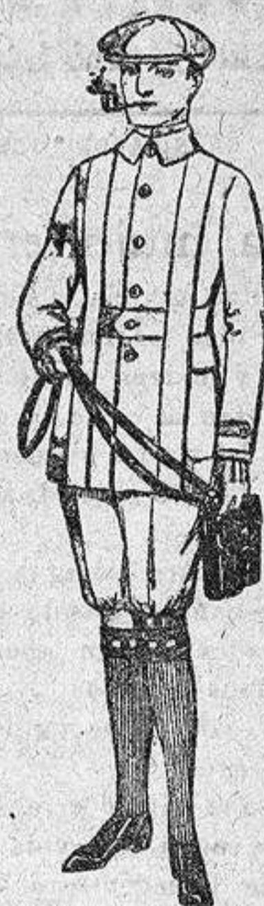
Cazadoras de dril crudo o kaki, de 16 a 22 ptas. Pantalones cortos de dril beige o gris, para excursionistas de 9 a 15 ptas.

ROPAS CONFECCIONADAS para Caballero, Señora, Niño y Niña