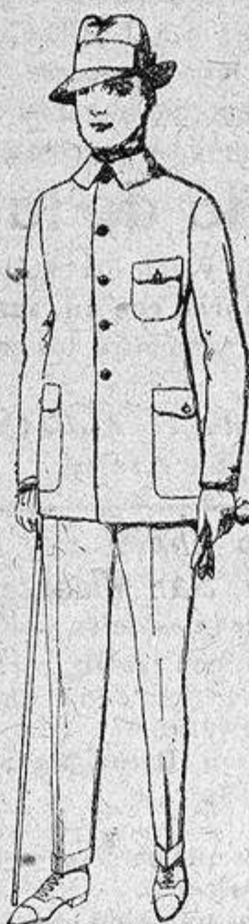
Guerreras de dril crudo kaki o blanco de 7.50 a 15 pesetas. Pantalones de dril crudo kaki o blanco, de 6 a 14.