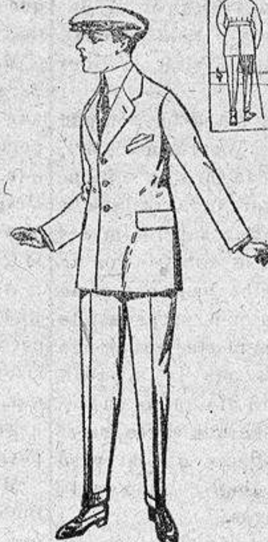
Trajes modelo «Sport», de lanilla, melton, etcétera, para jóvenes de 10 a 16 años, de 27 a 60 ptas.