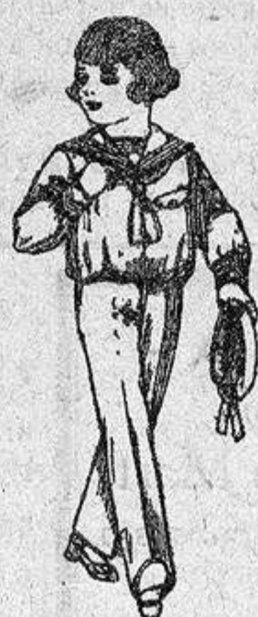
Trajes modelo «Marinera» de dril otomán blanco para niños de 3 a 9 años, de 14 a 22 ptas.