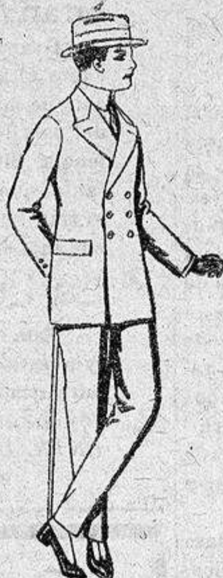
Trajes de lanilla, vicuña o estambre, para jóvenes de 19 a 20 años, de 23 a 60 pesetas.