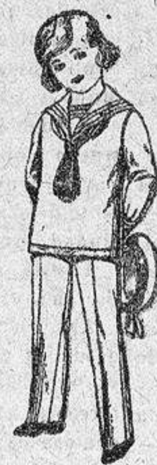
Trajes modelo «Marinera» inglesa, de vicuña o estambre azul y negro, para niños de 3 a 9 años, de 26 a 45 ptas.