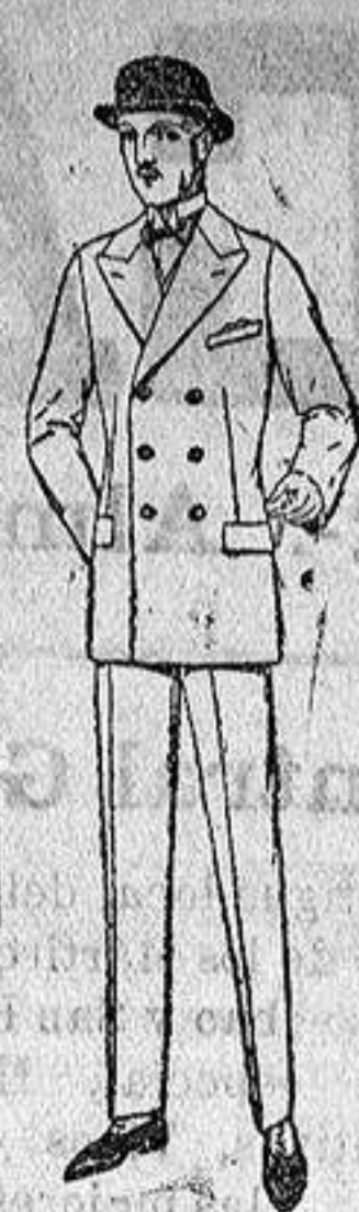
Trajes de melión, cheviot, estambre, etc. De ptas. 38 a 150