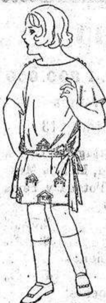
Batas de crespón, en negro y colores, adornos bordados. de ptas. 32 a 33