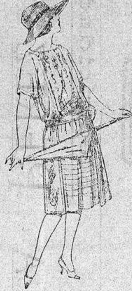
Vestidos de voile, adornos bordados para jovencitas de 13 a 15 años a ptas. 40.