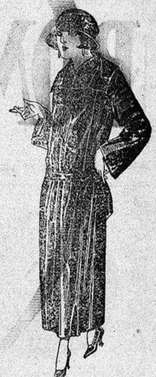
Abrigos de gabardina, inglesa impermeabilizada, en negro azul y color, a ptas. 130