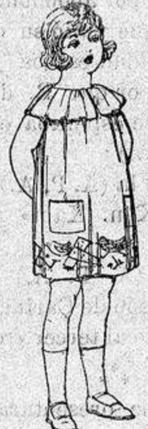
Delantales estamin colores moda adornos bordados para niños de 5 a 6 años de ptas. 8'50 a 6'50

Ropas confeccionadas para Caballero, Señora, Niño y Niña