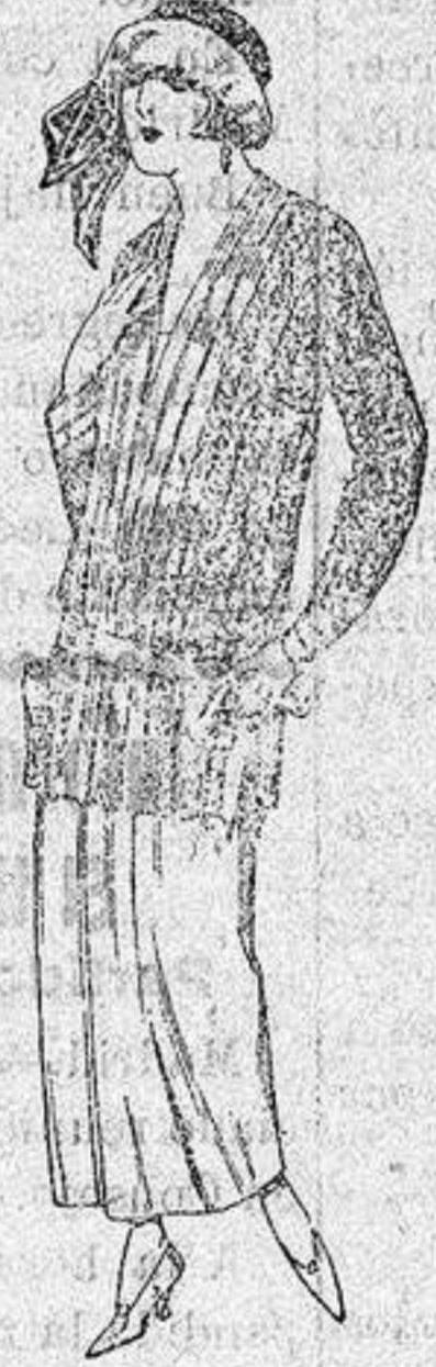
Paletots de punto de seda, dibujos novedad, a ptas. 90.