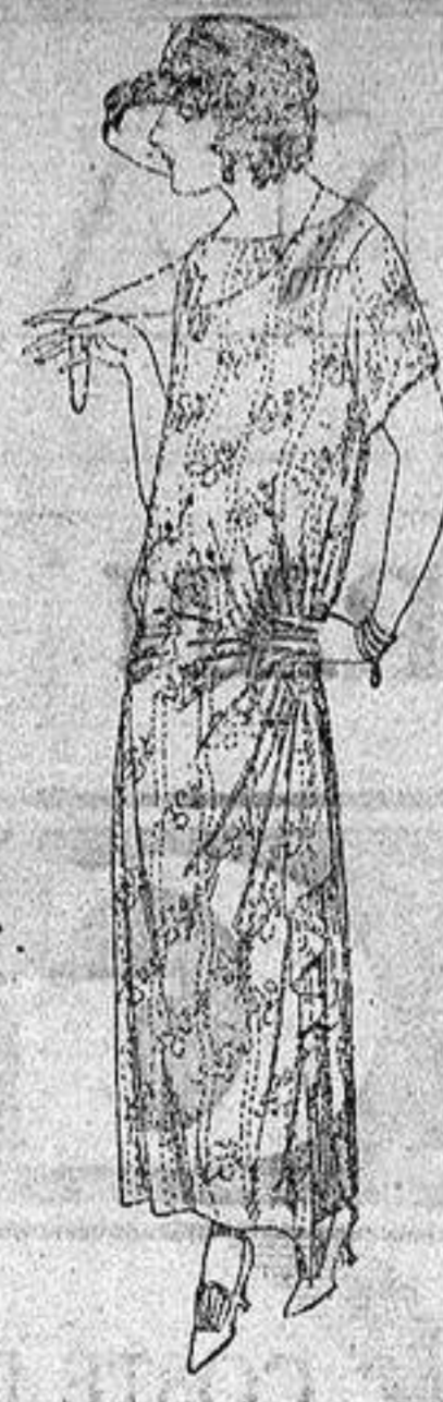
Vestidos de voile, dibujos moda, adornos plizados, broches fantasía, a ptas. 62.