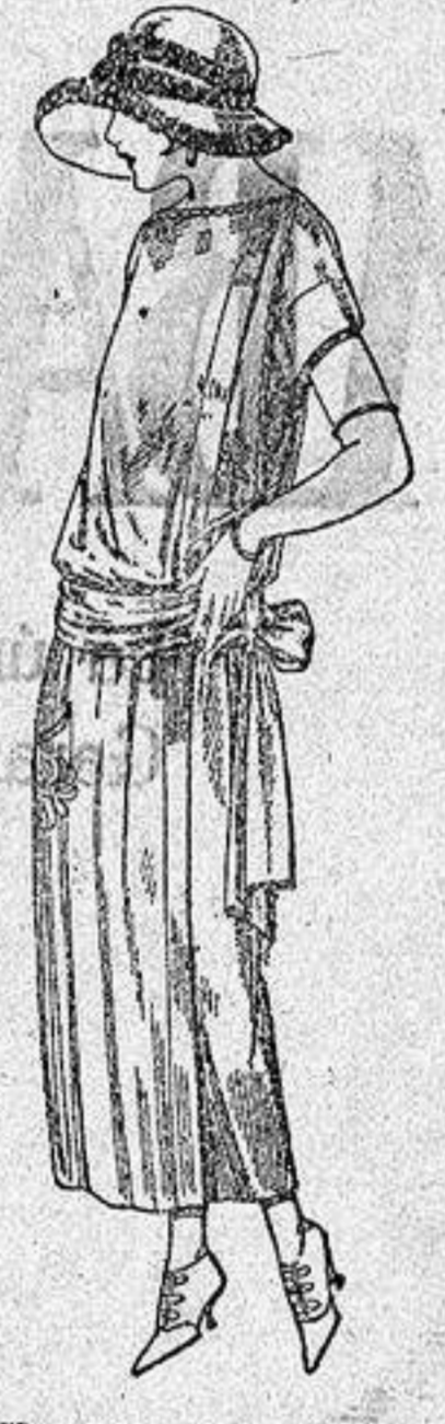
Vestidos de tricót de seda, en negro, azul y colores moda, adornos bordados a mano, a ptas. 125.