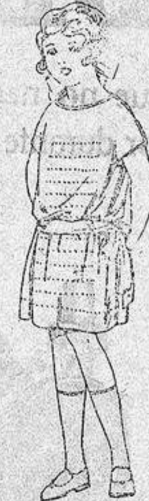
Vestidos voile, adornos calados para niñas de 4 a 6 años, de ptas. 15 a 18.

Boas, Camisería, Géneros de punto Corbatería, Guantería, Sombrerería Zapatería, Paraguas Bastones y Sombrillas