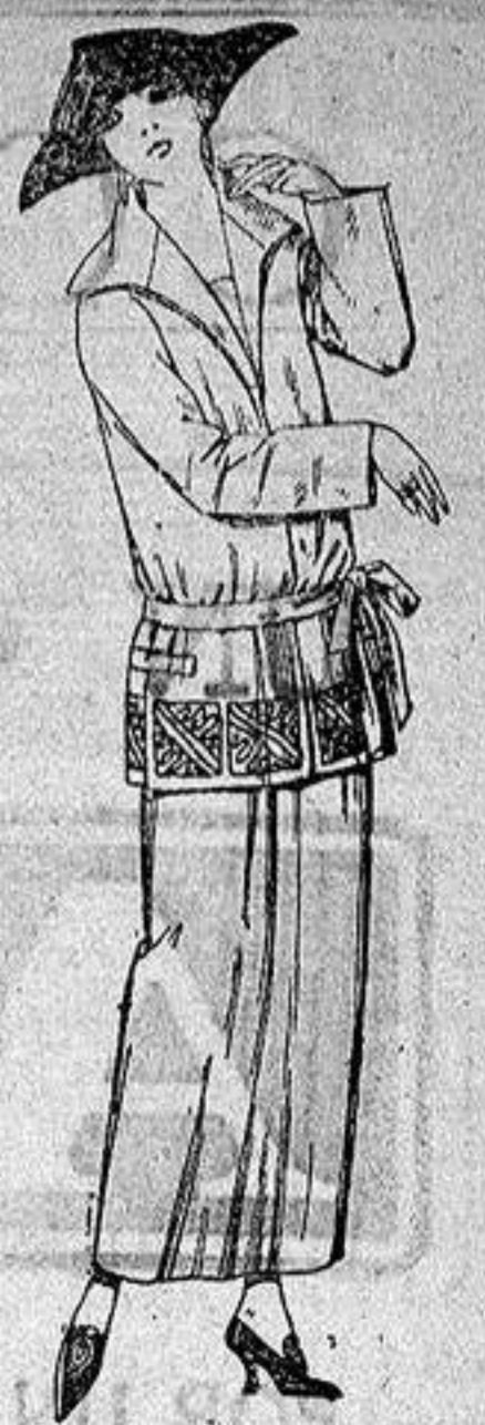
Trajes sastre, de gabardina, sarga inglesa etc., adornos bordados en negro azul y colores moda, a ptas. 115.