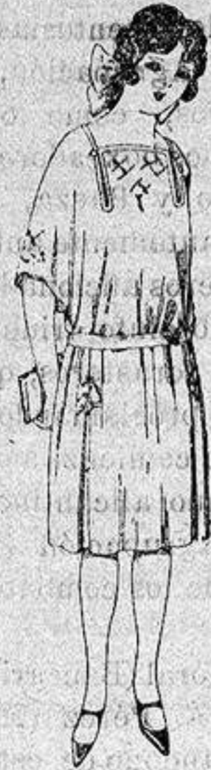
Vestidos de popeline, estambre, etc. en azul y colores moda adornos bordados para jovencitas de 13 a 15 años a ptas. 60