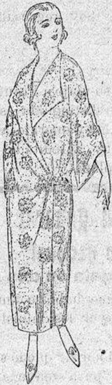
Batas de crespón estampado broche de adorno, a ptas. 25