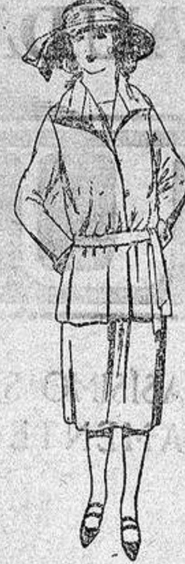
Trajes sastre de gabardina, sarga inglesa etc. en azul y color para jovencitas de 13 a 15 años.