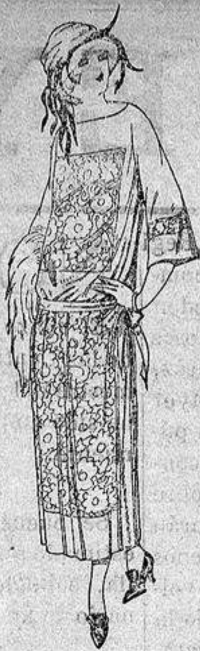
Vestidos de popeline, crespón etc., en negro azul y color, adornos bordados, a ptas. 130