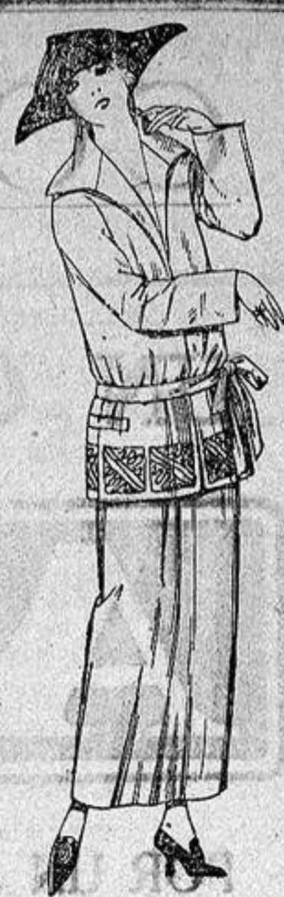
Trajes sastre, de gaba- dina, sarga inglesa etc., adornos bordados en ne- gro azul y colores moda. a ptas. 115.