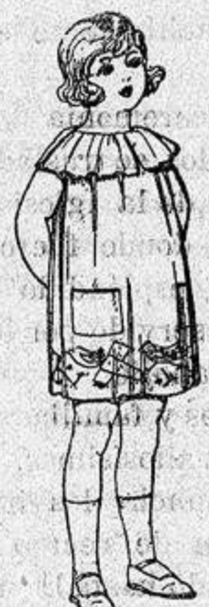
Delantales et min co- lores moda adornos bordados para niños de 5 a 6 años de ptas. 8'50 a 6'50

Ropas confeccionadas para Caballero, Se- ñora, Niño y Niña