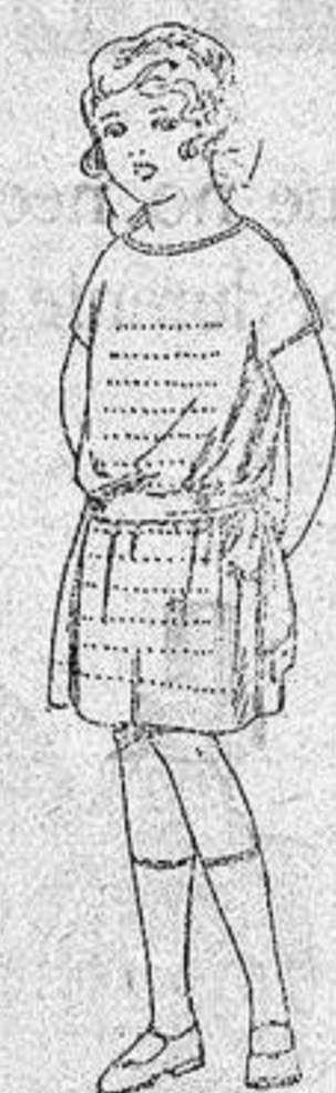
Vestidos voile, adorno calados para niñas de 4 a 6 años. de ptas. 15 a 18.

Boas, Camisería, Géneros de punto Corbata- ria, Guantería, Sombrereria Zapatería, Para- guas Bastones y Sombrillas