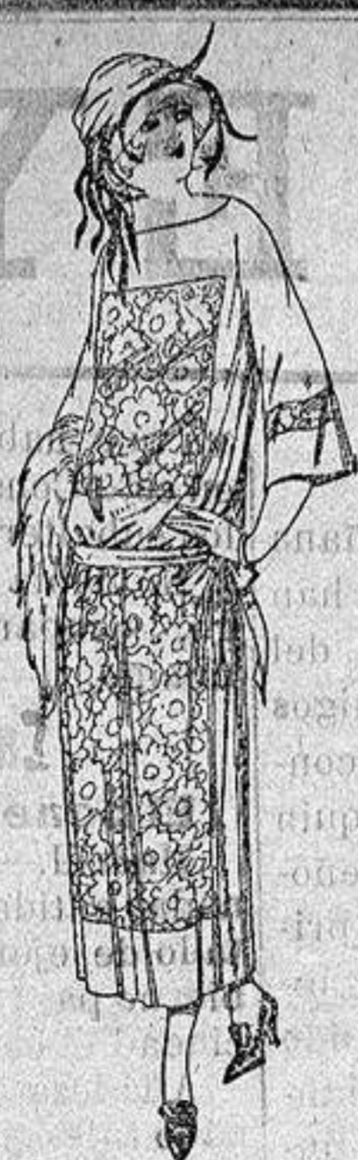
Vestidos de popeline crispón etc., en negro azul y color, adornos bordados. a ptas. 130