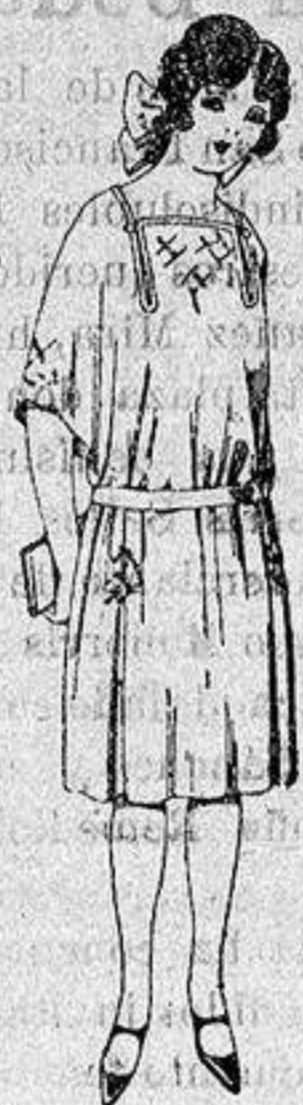
Vestidos de popeline, estambre, etc. en azul y colores moda adornos bordados para juven- cillas de 13 a 15 años. a ptas. 60