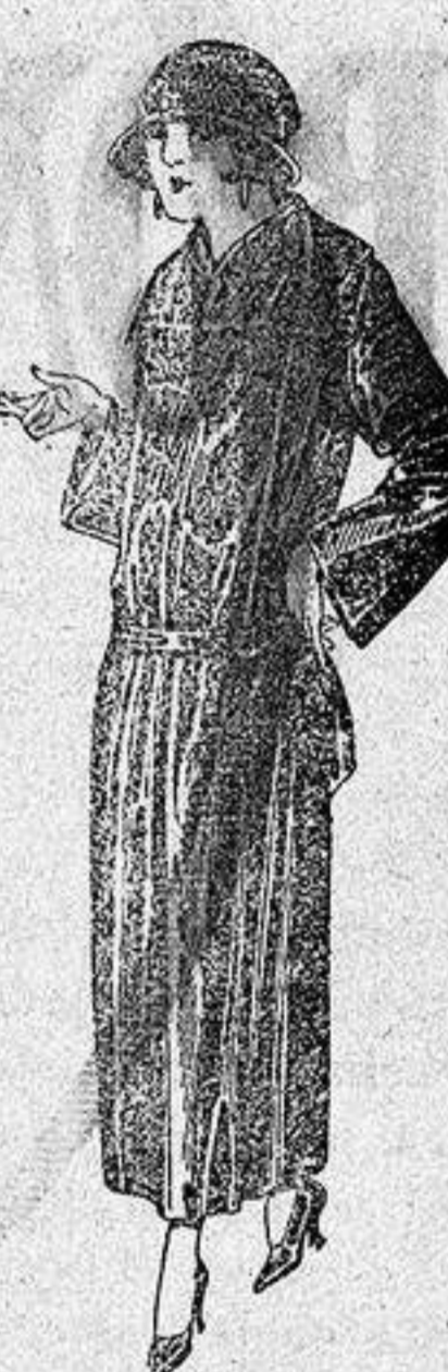
Abrigos de gabardina, in- glesa impermeabilizada, en negro azul y color. a ptas. 130