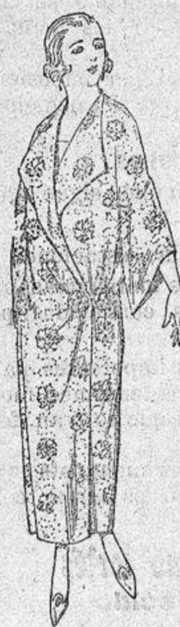
Batas de crispón estampa- do broche de adorno. a pesetas 25