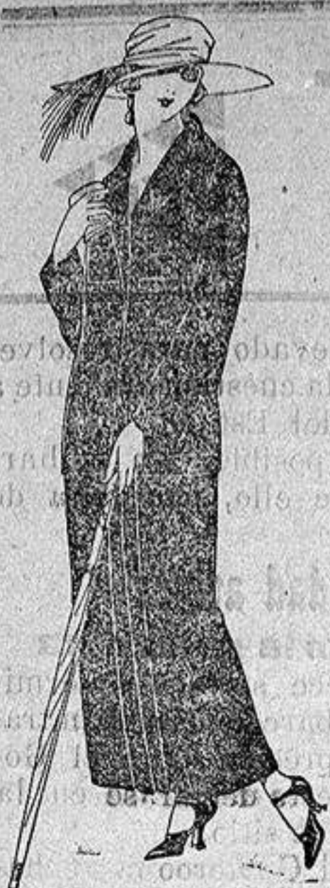
Trajes sastre, de sarga in- glesa, popeline, etc., adorno bordados, chaqueta for- rrada de seda, en negro, azul y colores moda de ptas. 120 a 135

Altamira, 2 :: Alicante :: Victoria, 1 Sucursales: Madrid, Barcelona, Almeria, Bilbao, Cadiz, Cartagena, Gijón, Granada, Málaga, Palma de Mallorca, Santander, Sevilla, Va- lencia, Valladolid, Zaragoza