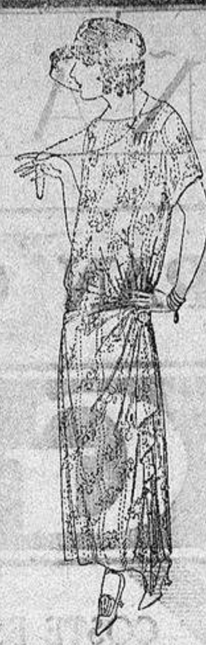
Vestidos de voile, di- bujos moda, adornos plizados, broches fan- tasia. a ptas. 62.