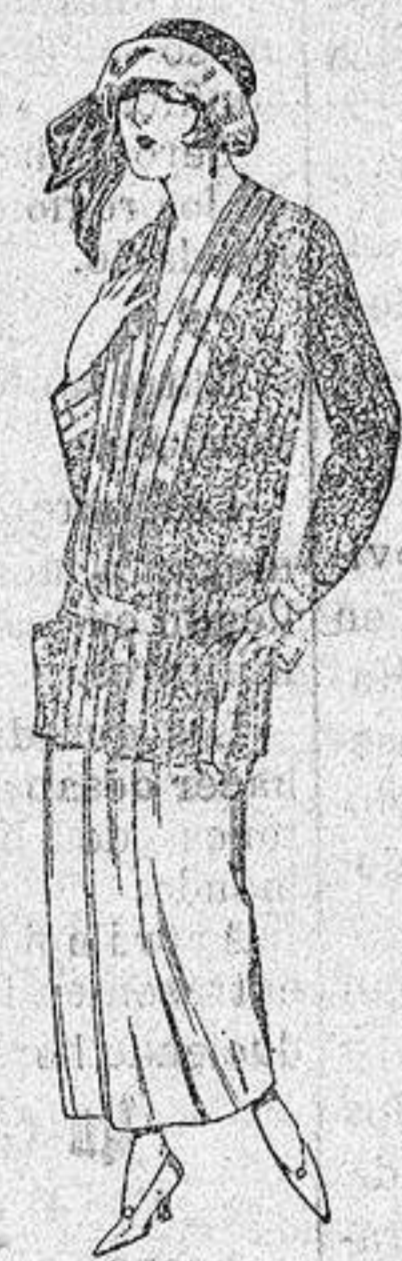
Paletots de punto de seda, dibujos novedad. a ptas. 90.