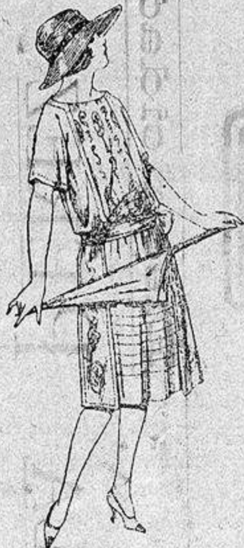
Vestidos de voile, adorno bordado para juven- cillas de 13 a 15 años a ptas. 40.