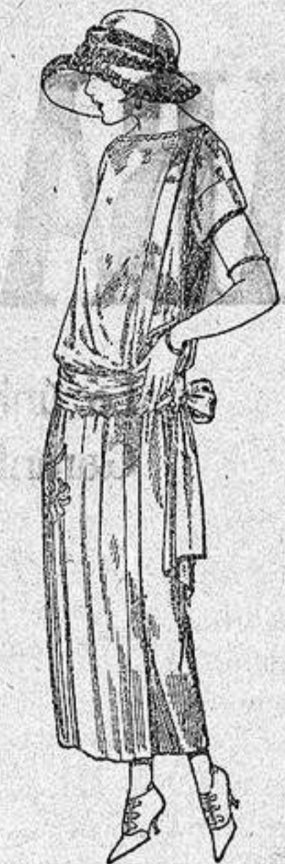
Vestidos de tricot de seda, en negro, azul y colores moda, adornos bordados a mano. a ptas. 125.